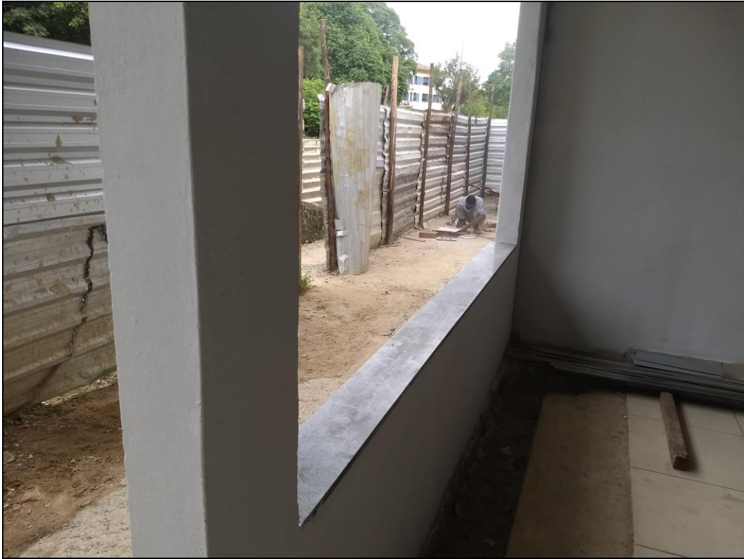
Foto 07 - Instalação de pedras de granito nas soleiras e peitoris dos vãos das portas e janelas do refeitório nº 02