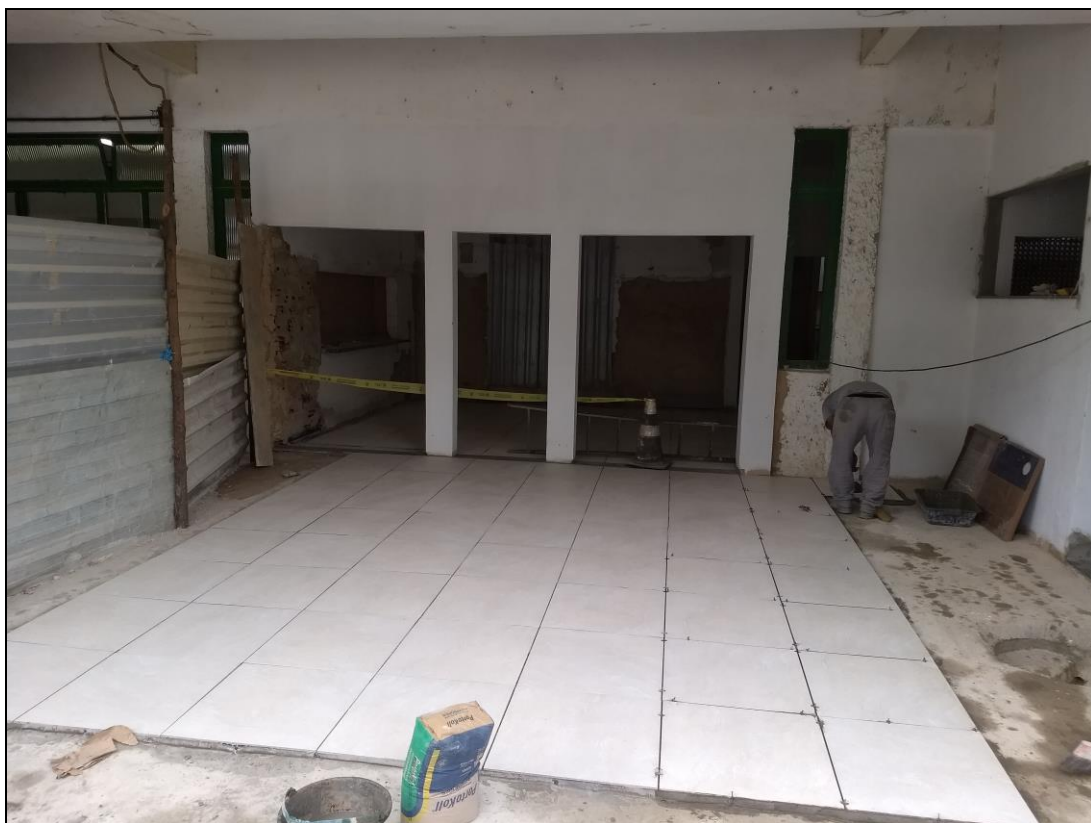
Foto 09 - Início da execução do revestimento cerâmico do piso da varanda entre os banheiros