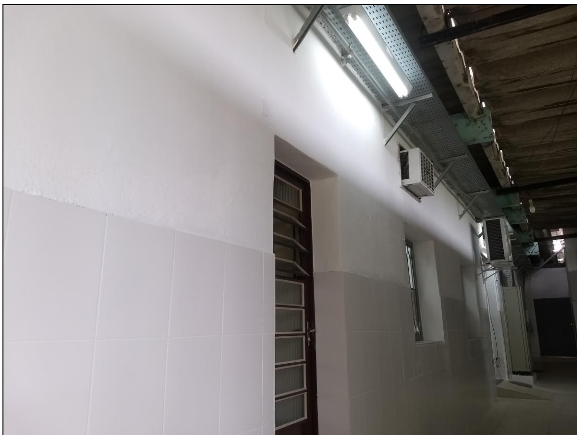
Foto 21 - Pintura do corredor de acesso da área de serviço nos fundos do RU;