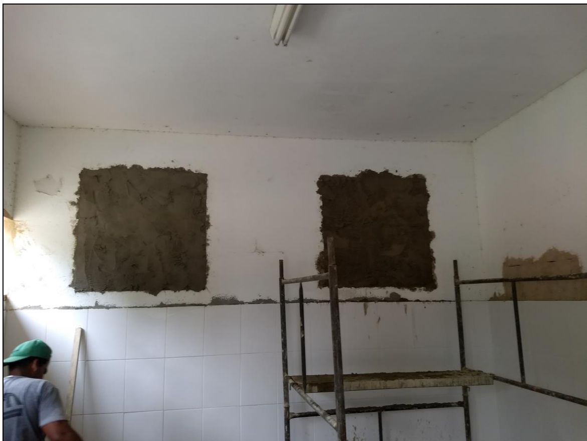
Foto 12 - Fechamento e abertura dos vãos das janelas dos banheiros