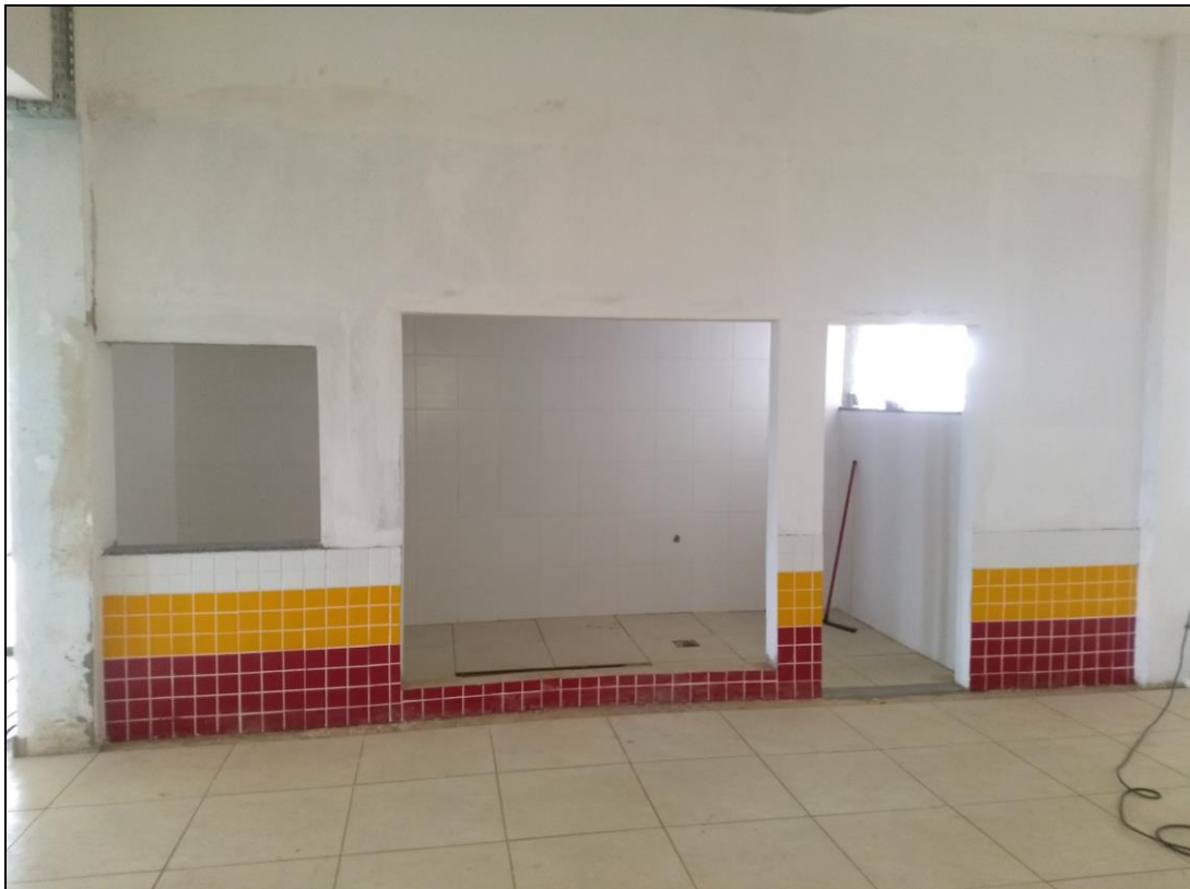
Foto 03 - Execução do revestimento cerâmico das paredes e do piso da área de sucos do refeitório nº 02