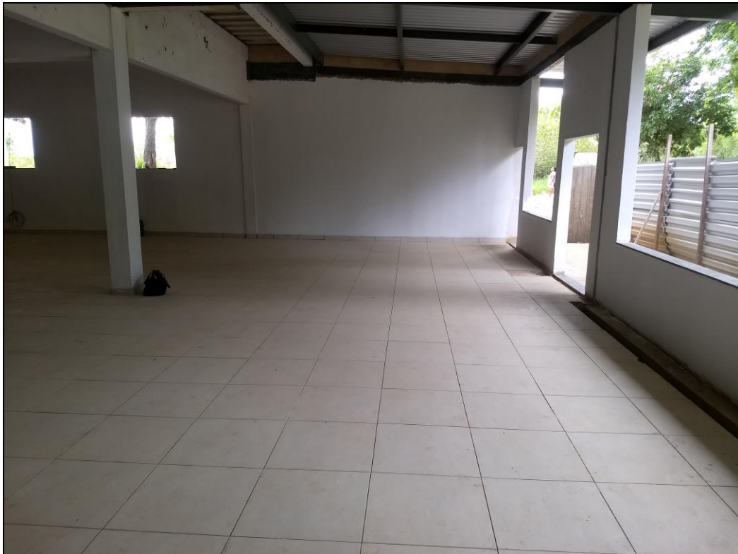
Foto 01 - Finalização da execução do revestimento cerâmico das paredes e do piso do refeitório nº02