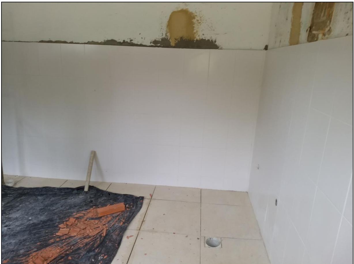
Foto 14 - Execução do revestimento cerâmico do piso e da parede do banheiro feminino