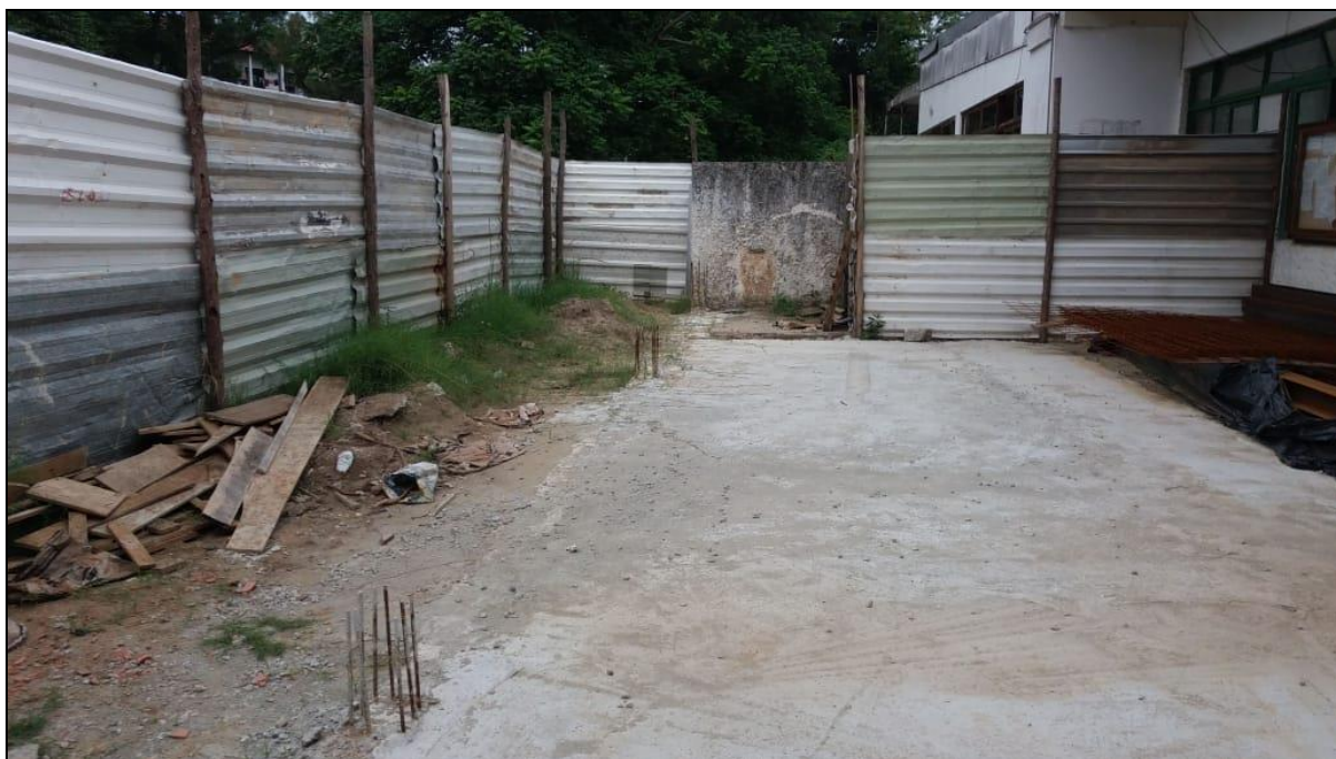
Foto 25 - Execução do contra piso do refeitório nº 01.