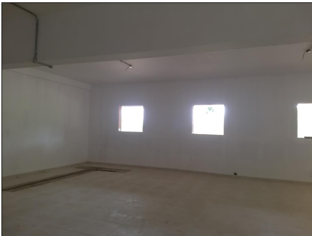
Foto 05 - Início da pintura das paredes do refeitório nº 02