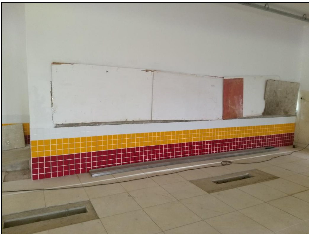
Foto 02 - Finalização da execução do revestimento cerâmico das paredes e do piso do refeitório nº02