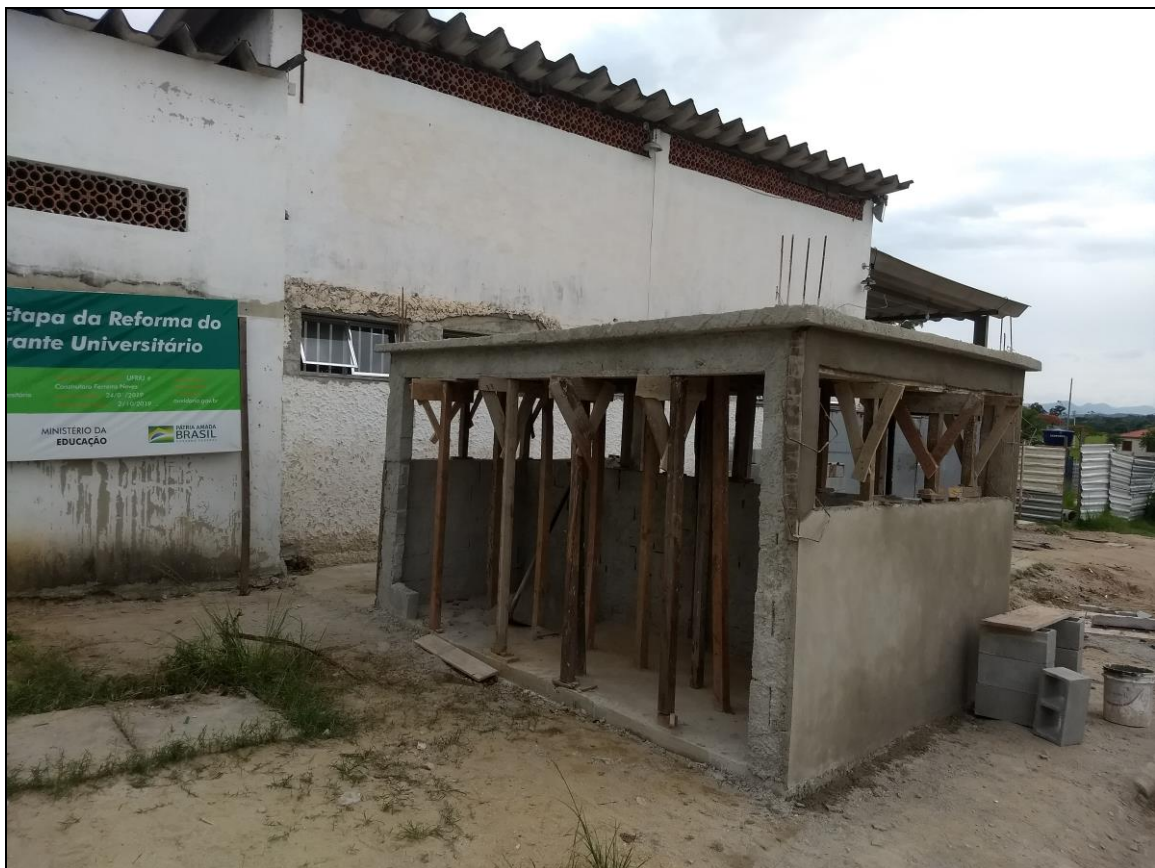
Foto 20 - Construção da casa de gás, mediante a execução da laje do piso, das paredes de alvenaria, da laje de cobertura e chapisco.