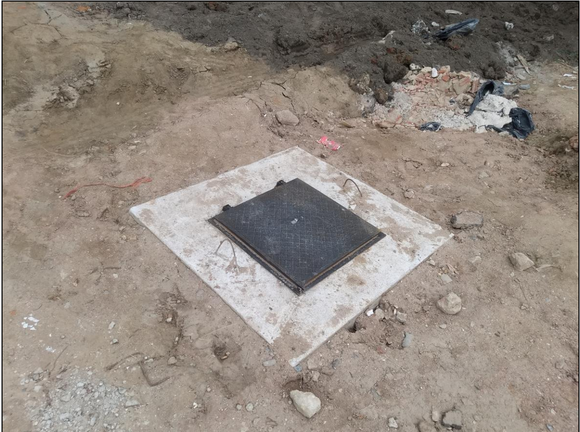
Foto 23 - Instalação de caixas de esgoto junto à lateral do refeitório nº 02