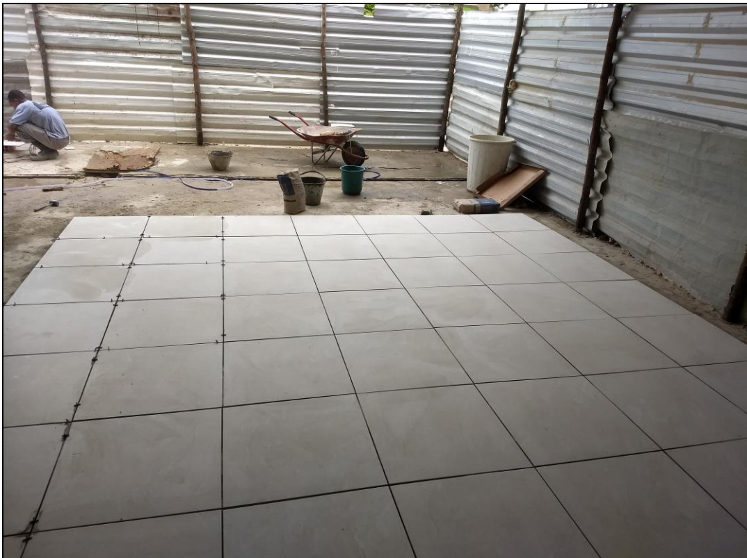
Foto 08 - Início da execução do revestimento cerâmico do piso da varanda entre os banheiros