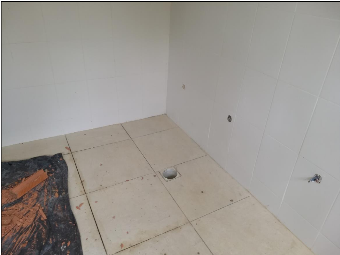
Foto 15 - Execução do revestimento cerâmico do piso e da parede do banheiro feminino