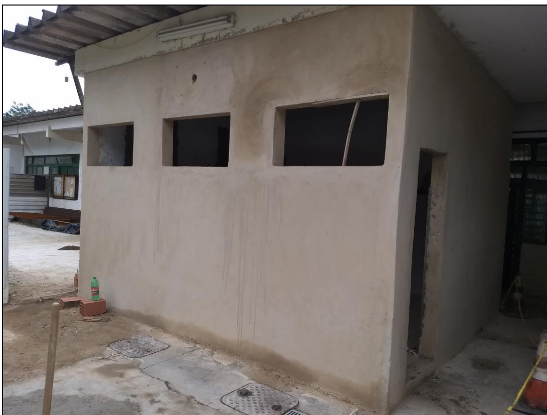
Foto 10 - Execução do emboço nas paredes das fachadas