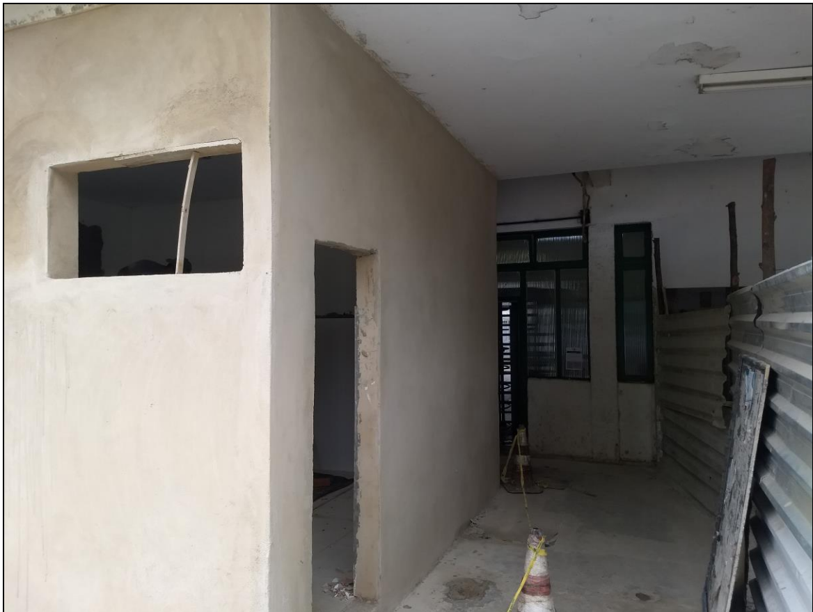
Foto 11 - Execução do emboço nas paredes das fachadas