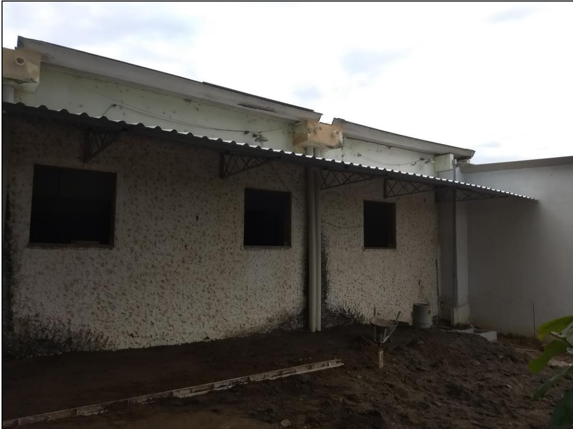
Foto 17 - Instalação da cobertura externa lateral do refeitório nº 02