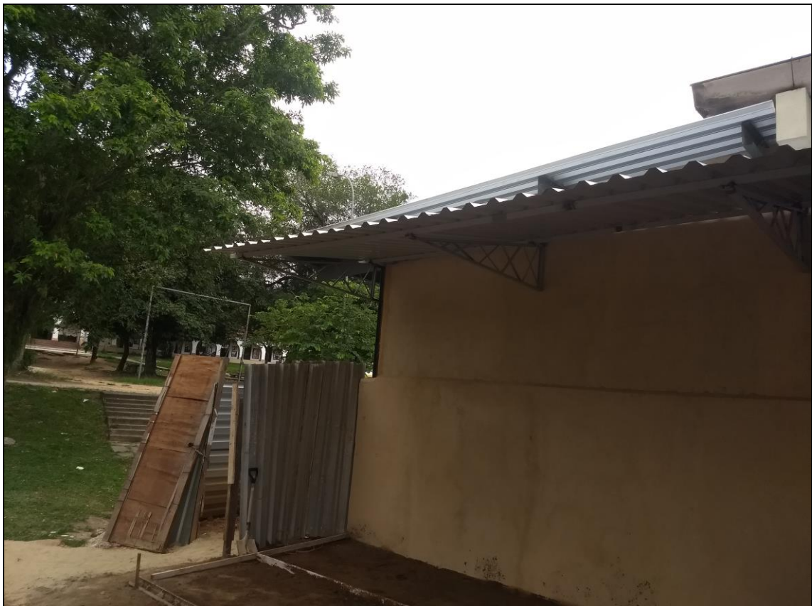
Foto 18 - Instalação da cobertura externa lateral do refeitório nº 02