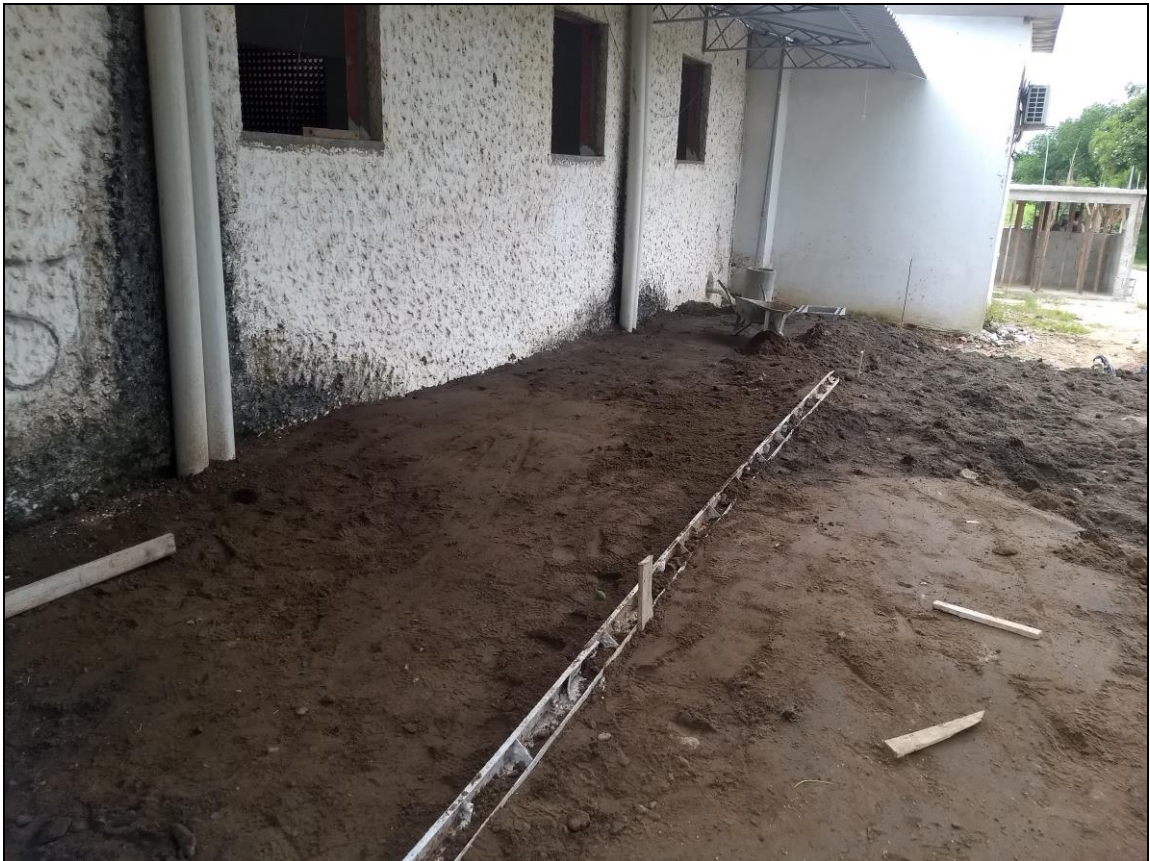
Foto 19 - Aterramento para a execução da calcada lateral do refeitório nº 02