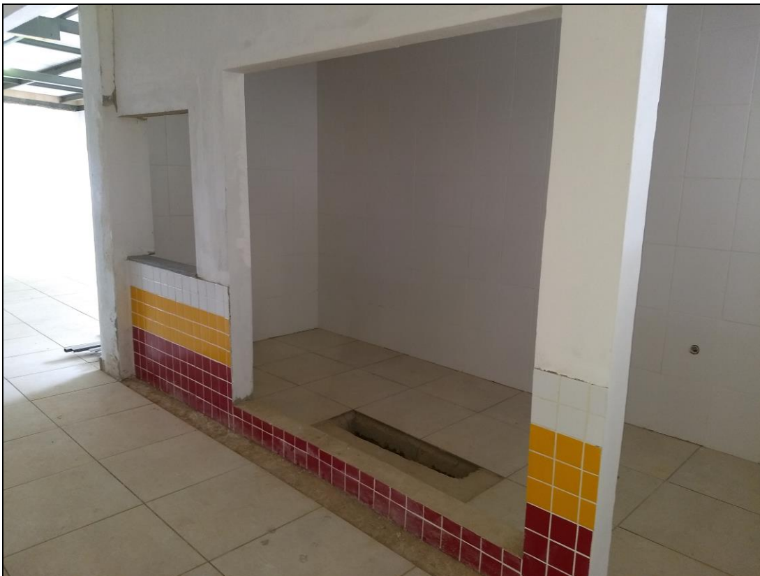
Foto 04 - Execução do revestimento cerâmico das paredes e do piso da área de sucos do refeitório nº 02