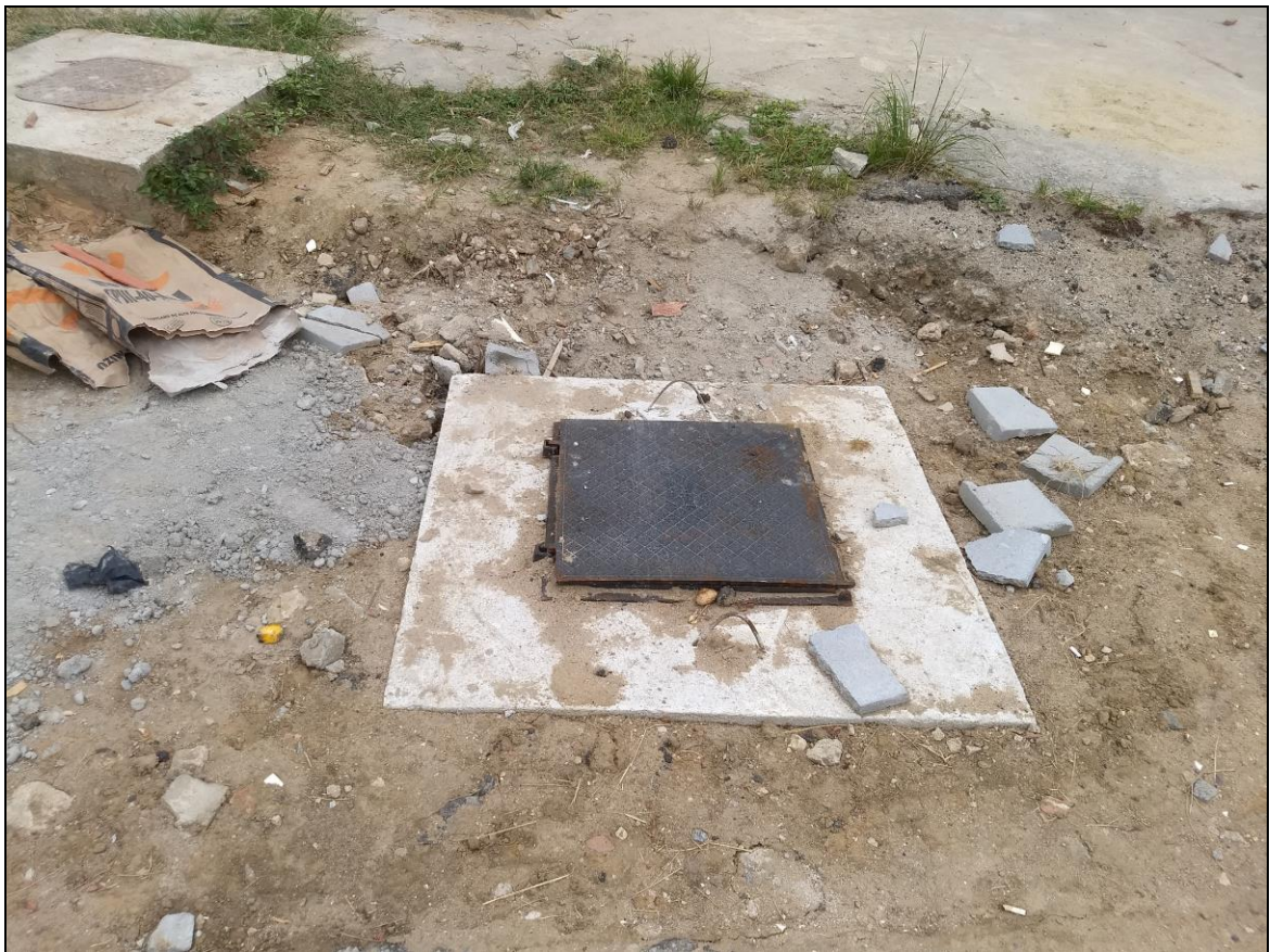
Foto 24 - Instalação de caixas de esgoto junto à lateral do refeitório nº 02