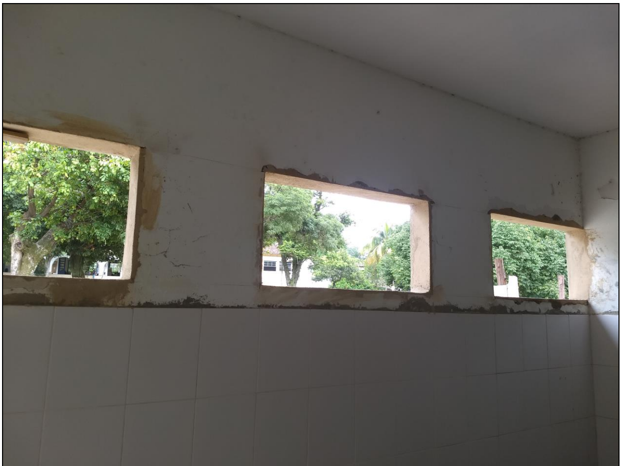
Foto 13 - Fechamento e abertura dos vãos das janelas dos banheiros