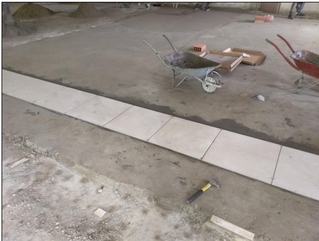
Foto 05 - Início da execução do revestimento cerâmico do refeitório nº 02.