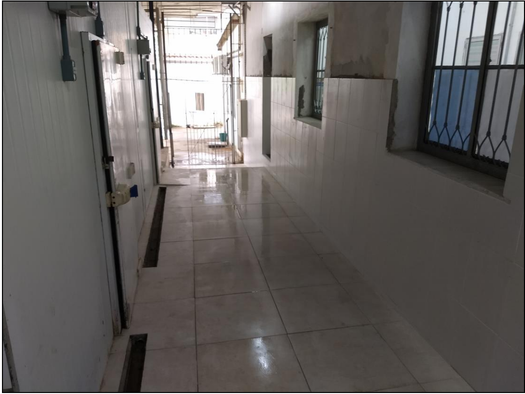
Foto 13 - Conclusão da instalação do revestimento cerâmico do corredor de acesso nos fundos do RU.