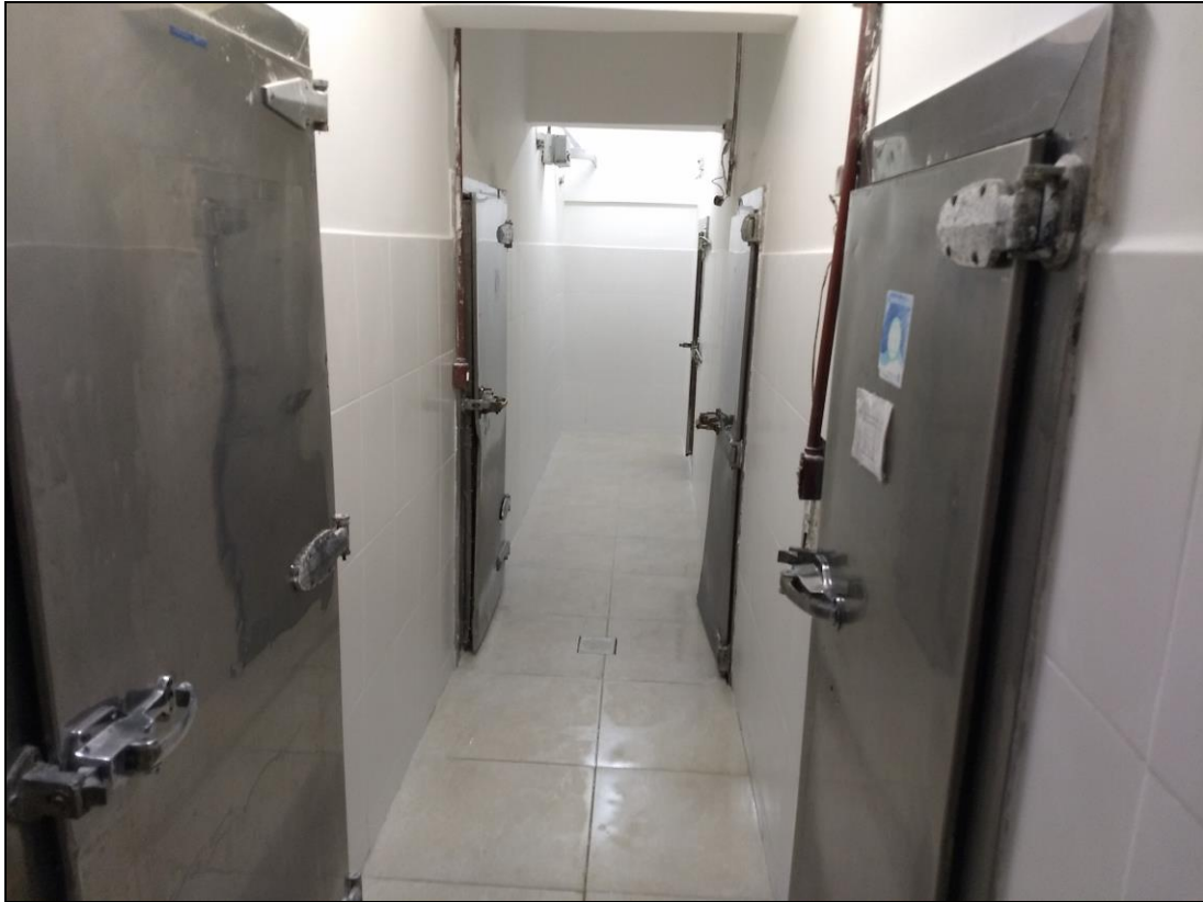
Foto 11 - Conclusão da instalação do revestimento cerâmico do corredor das câmaras frias.