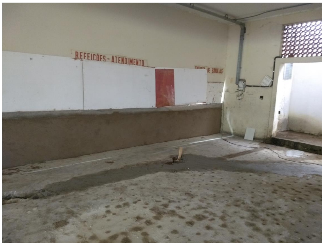
Foto 03 - Finalização do apicoamento e limpeza do antigo piso de granitina do refeitório nº 02;