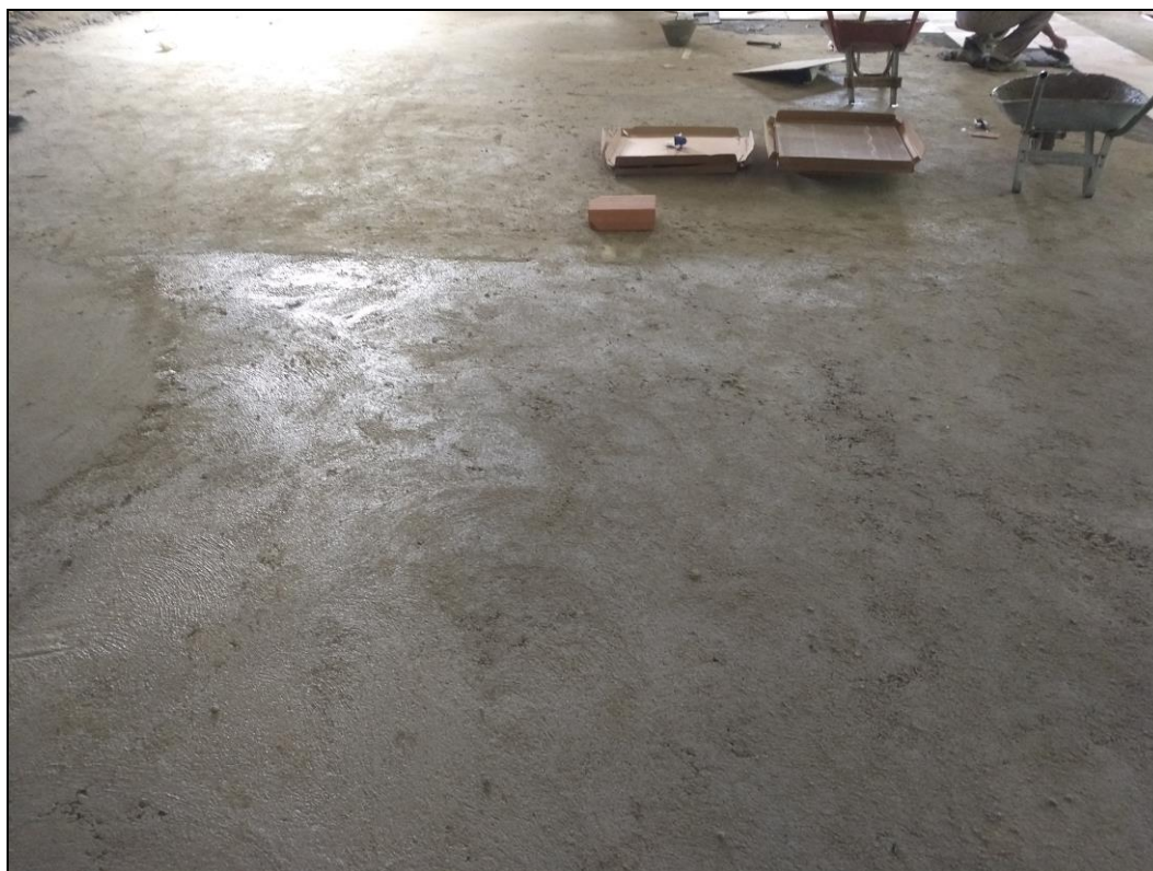
Foto 04 - Início da execução do revestimento cerâmico do refeitório nº 02.