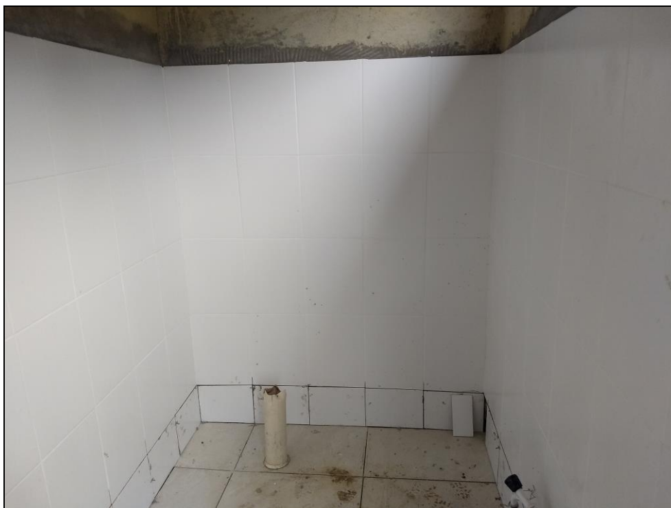
Foto 01 - Execução do revestimento cerâmico do banheiro acessível do refeitório nº 02