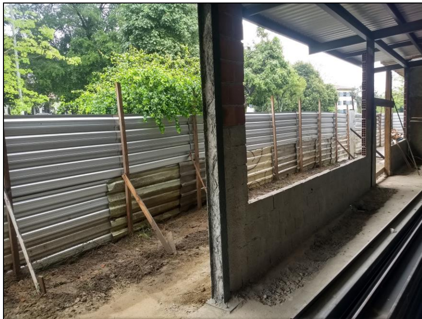
Foto 08 - Fechamento da lateral e fachadas do refeitório nº 02 (colocação de paredes).