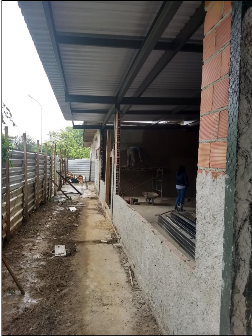
Foto 07 - Fechamento da lateral e fachadas do refeitório nº 02 (colocação de paredes).