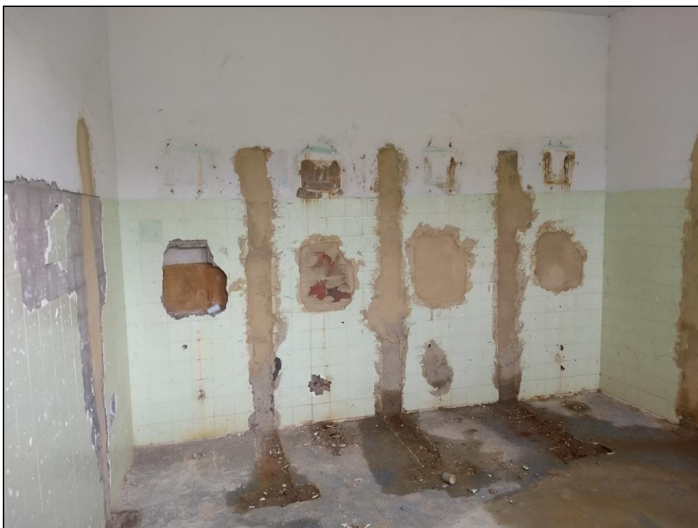
Foto 09 - Demolição do banheiro feminino, com remoção das louças e bancadas.