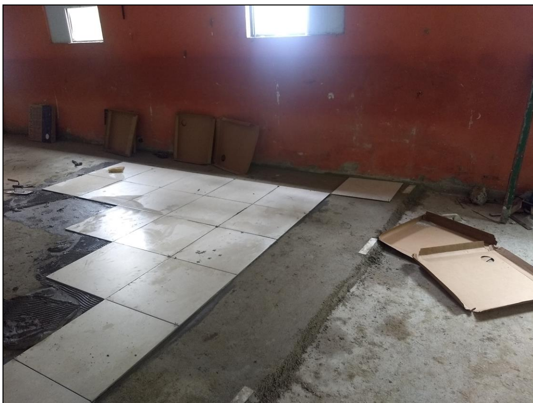
Foto 06 - Início da execução do revestimento cerâmico do refeitório nº 02.