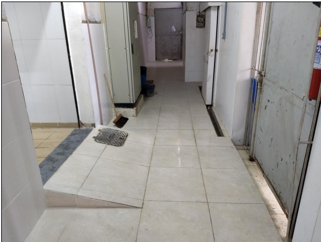
Foto 12 - Conclusão da instalação do revestimento cerâmico do corredor de acesso nos fundos do RU.