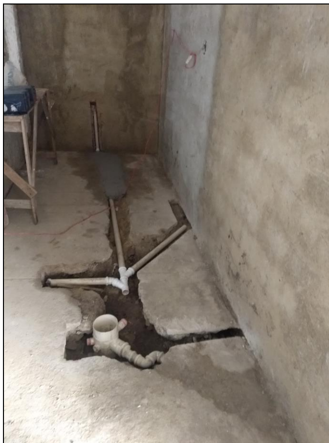
Figura 02 - Instalação da rede de esgoto dos banheiros masculino e das pessoas Portadoras de Necessidades Específicas (PNE);