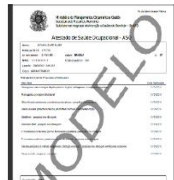
Emissão do ASO