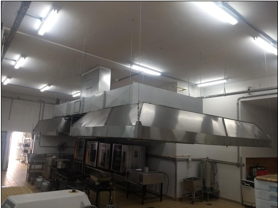
Foto 15 – Sistema de exaustão instalado com acabamento finalizado