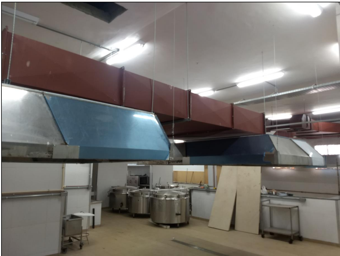
Foto 08 – Vista lateral da instalação da coifa sobre o local de instalação do fogão a gás do RU