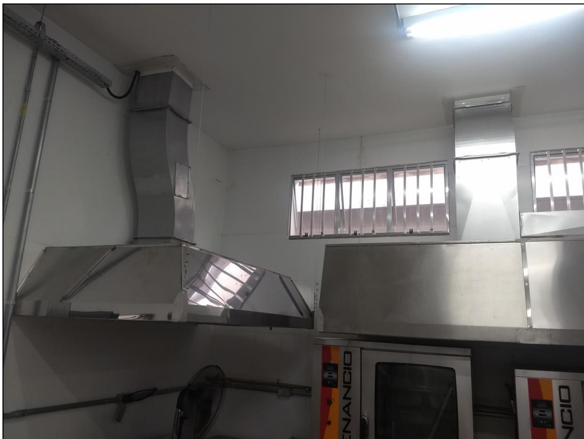
Foto 16 – Sistema de exaustão instalado com acabamento finalizado