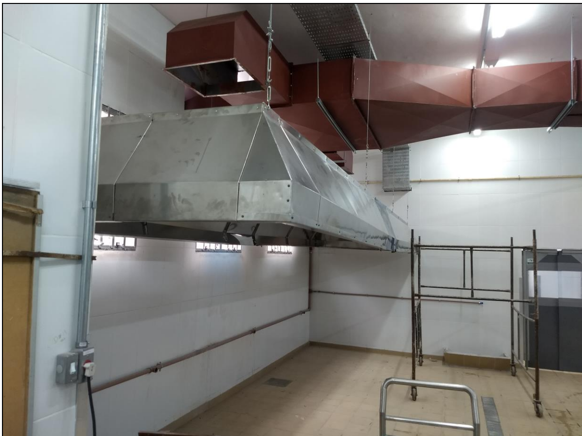
Foto 06 – Instalação da coifa sobre o local de instalação dos painões autoclavados do RU