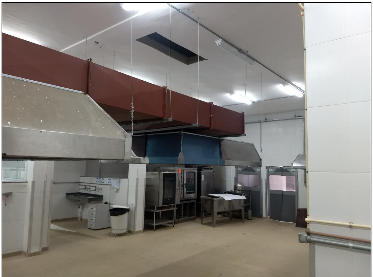
Foto 10 – Instalação da coifa sobre o local com fornos combinados posicionados