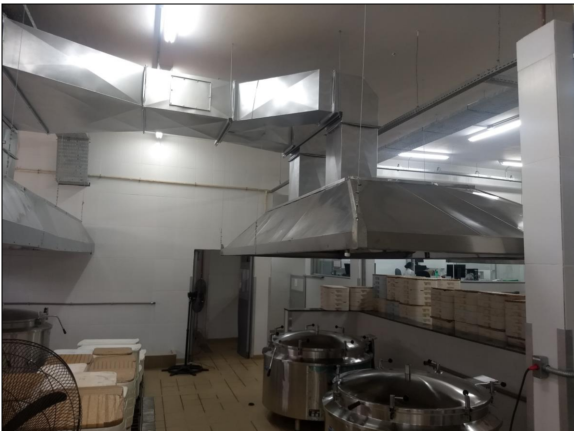
Foto 12 – Sistema de exaustão instalado com acabamento finalizado