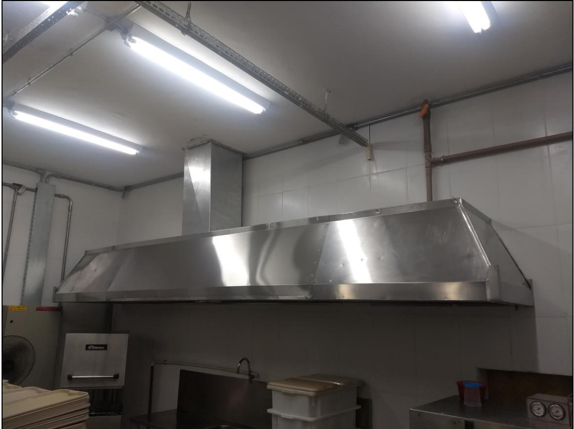
Foto 13 – Sistema de exaustão instalado com acabamento finalizado