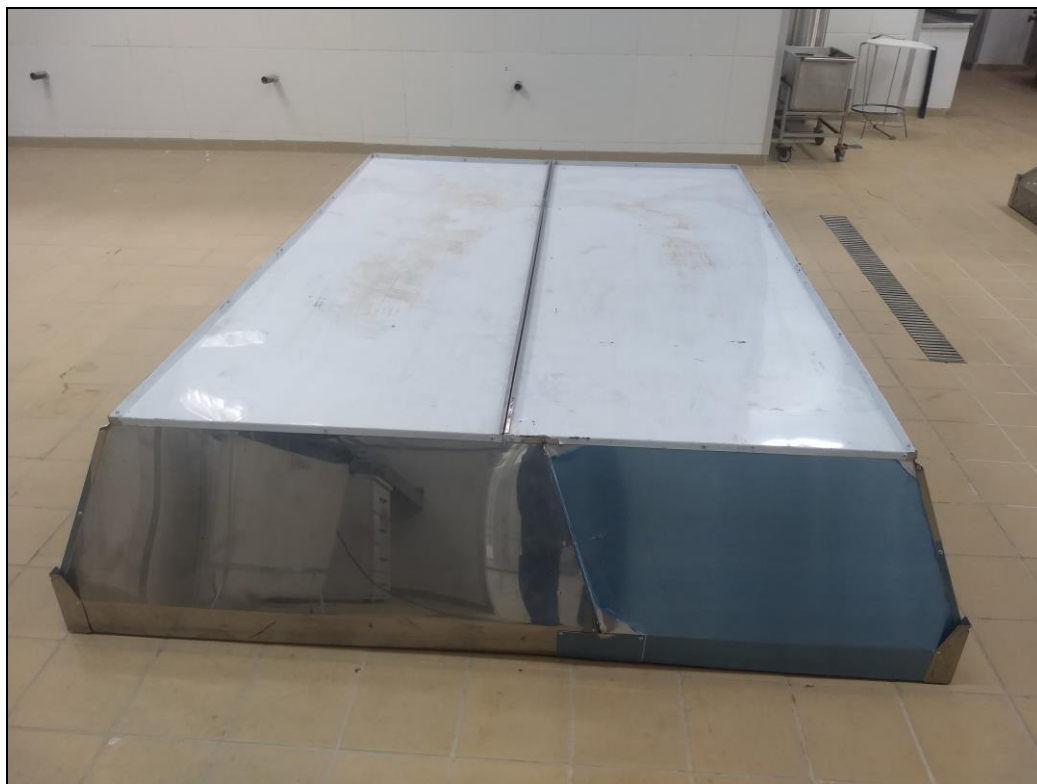
Foto 01 – Imagem da coifa de aço inoxidável antes de sua instalação