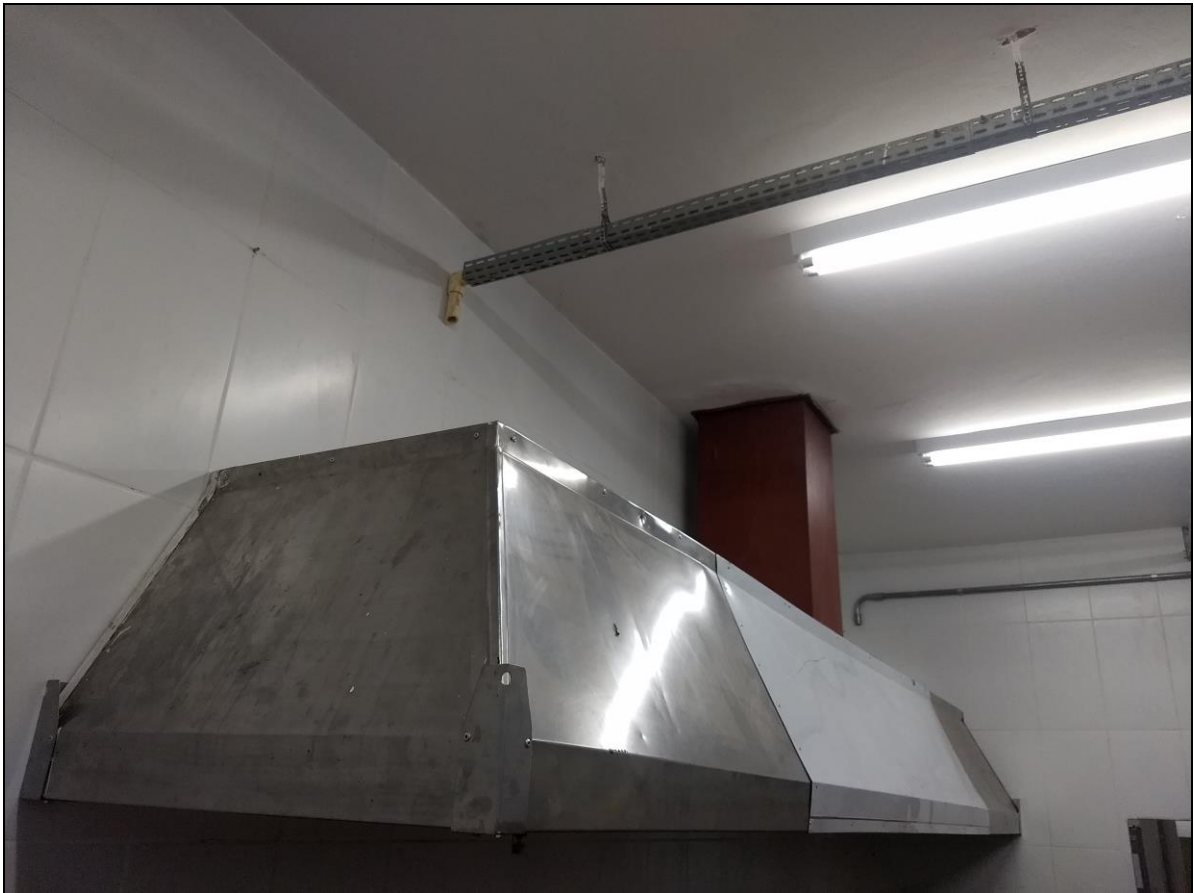
Foto 09 – Instalação da coifa sobre o local de instalação dos fornos combinados do RU