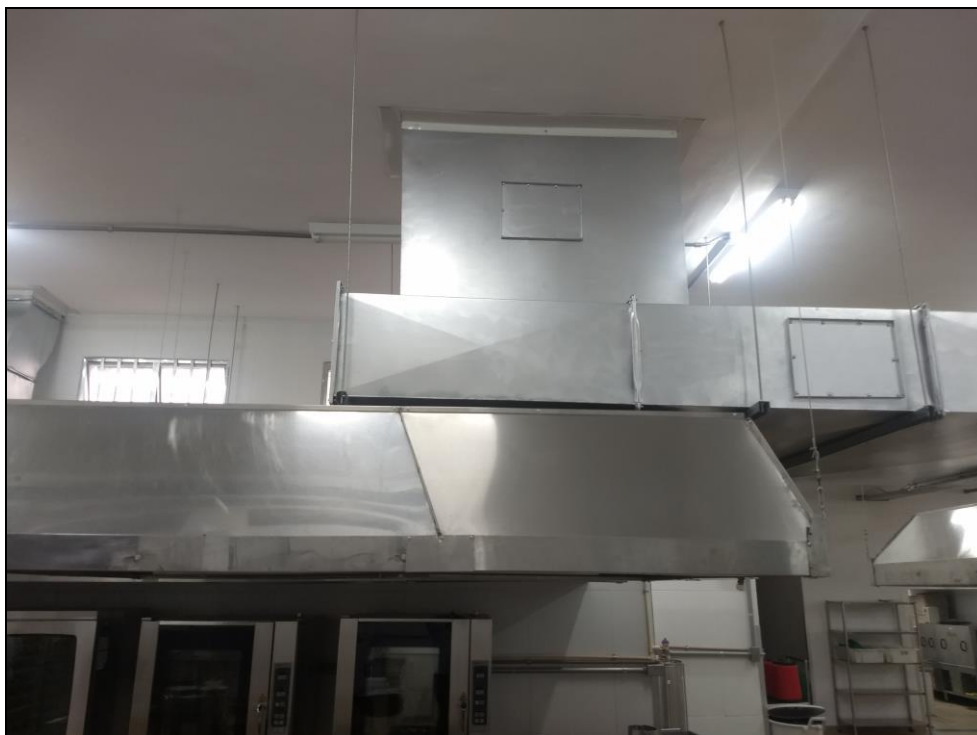
Foto 17 – Sistema de exaustão instalado com acabamento finalizado