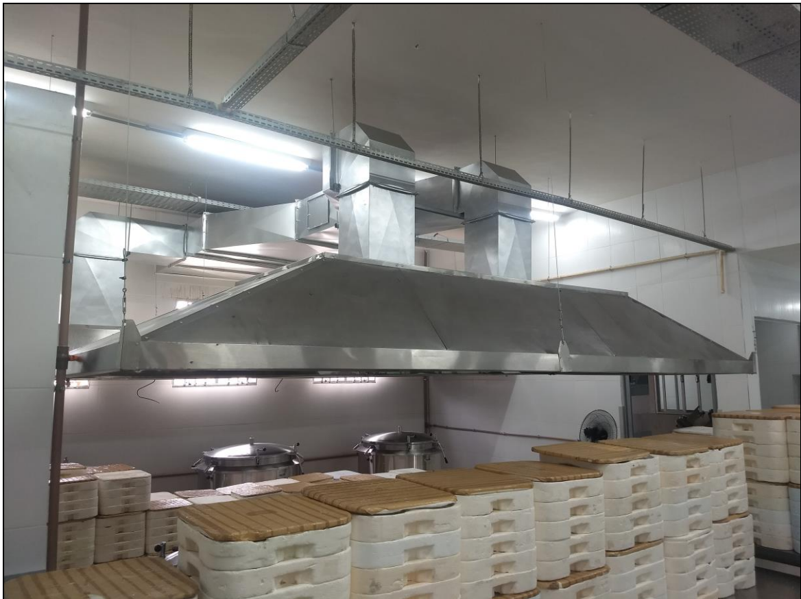
Foto 14 – Sistema de exaustão instalado com acabamento finalizado