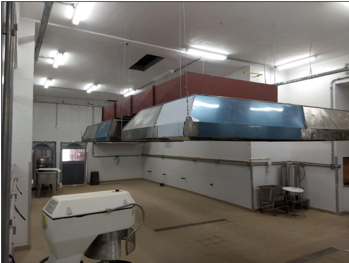
Foto 07 – Instalação da coifa sobre o local de instalação do fogão a gás do RU