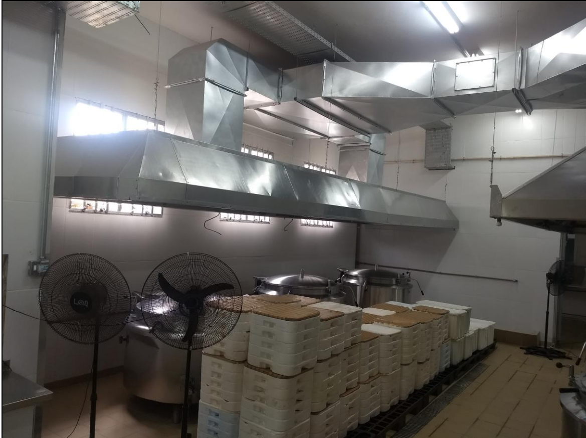
Foto 11 – Sistema de exaustão instalado com acabamento finalizado