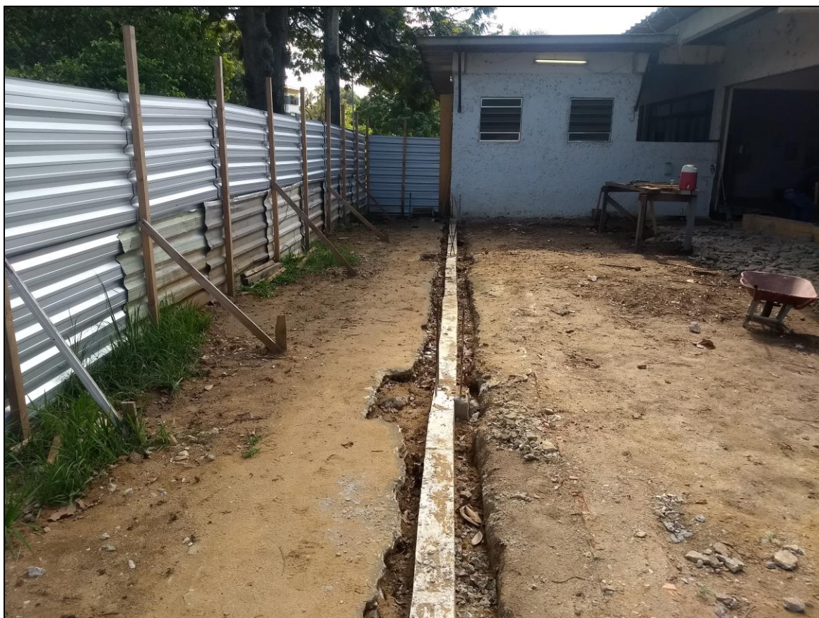
Foto 05 - Execução da fundação da área de expansão do refeitório número 02