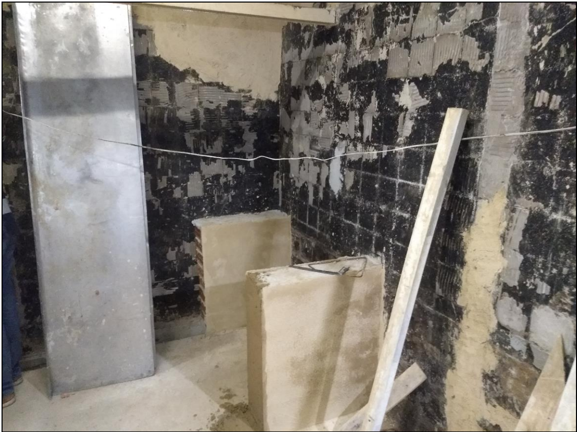
Foto 04 - Construção dos suportes de alvenaria para as bancadas do açougue