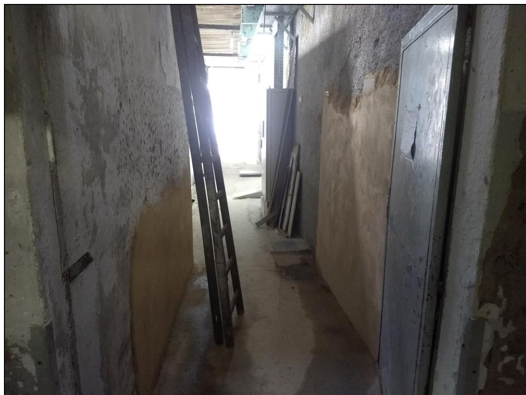
Foto 02 - Início do chapisco para a implantação do revestimento cerâmico do corredor de acesso às câmaras frias