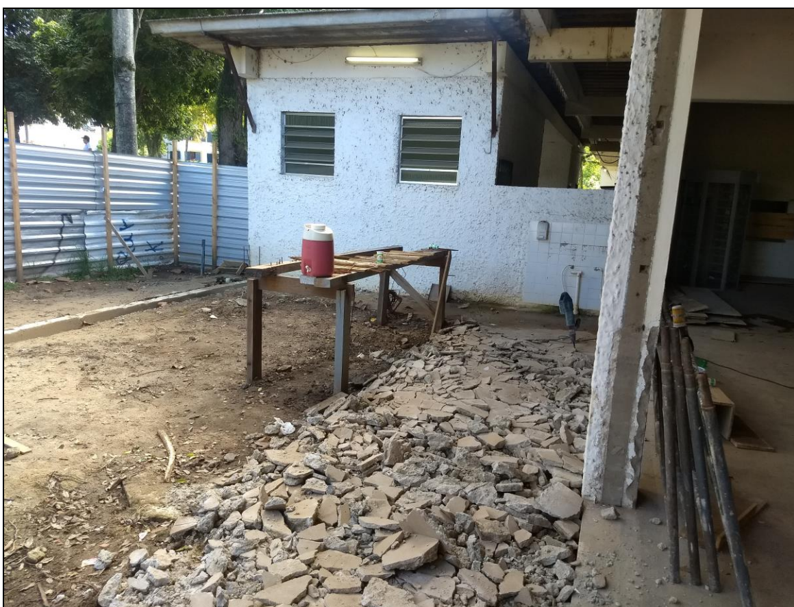
Foto 06 - Demolição da antiga calçada para a posterior instalação do piso da área de expansão do refeitório nº 02