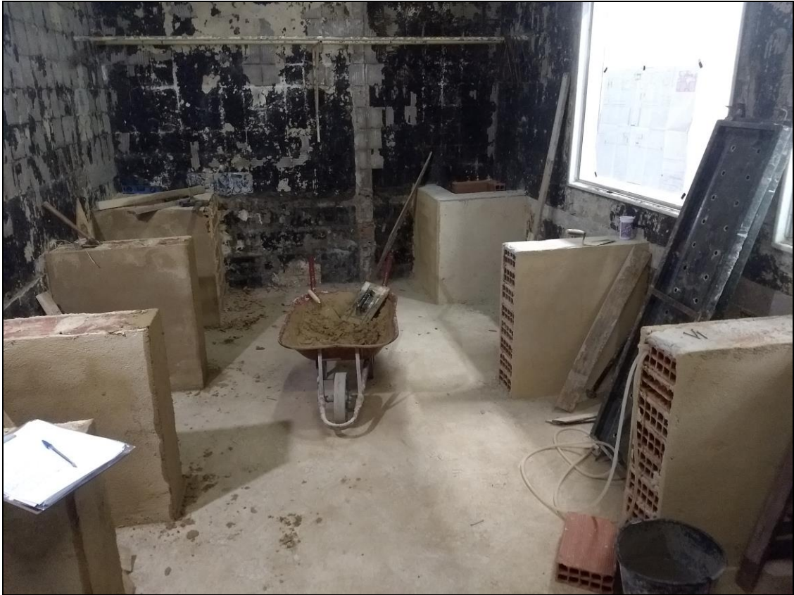
Foto 03 - Construção dos suportes de alvenaria para as bancadas do açougue