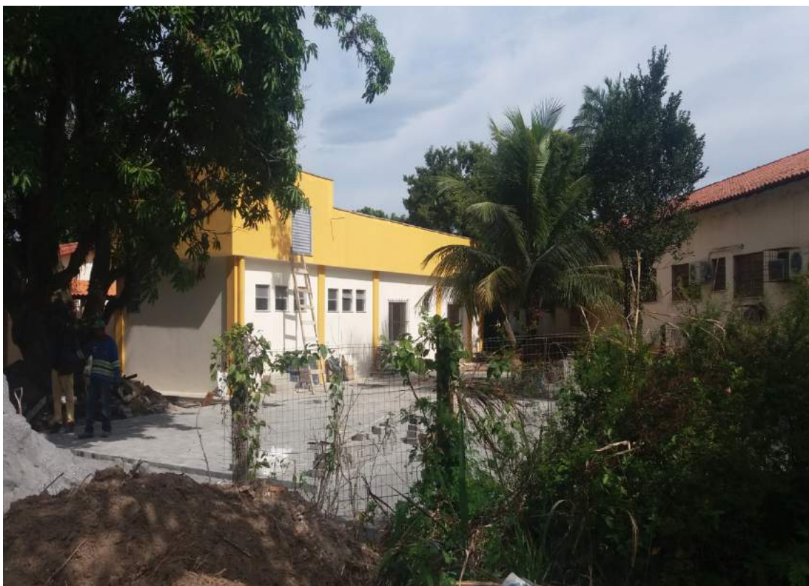
FUNDOS DO NOVO ANEXO DA DAST