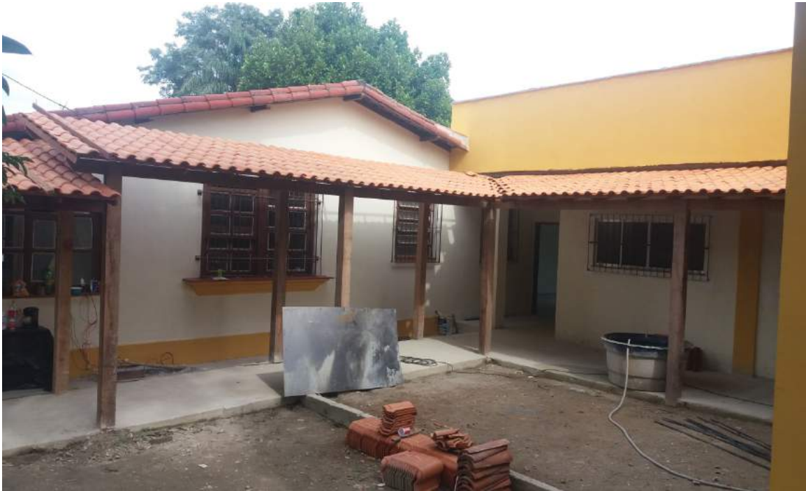
CORREDOR DE ENTRADA PARA O NOVO ANEXO DA DAST