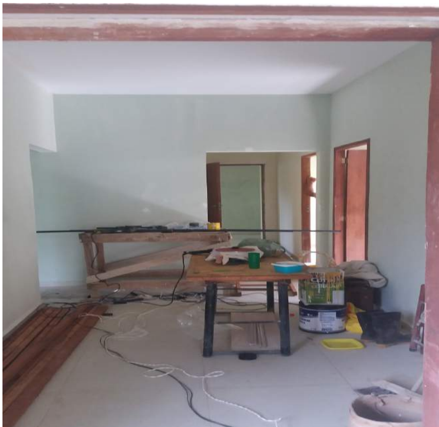
CORREDOR DE ACESSO ÀS SALAS DE ATENDIMENTO DA ANTIGA PNR