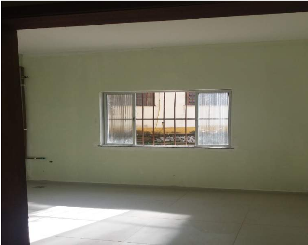
BANHEIRO DO NOVO ANEXO DA DAST