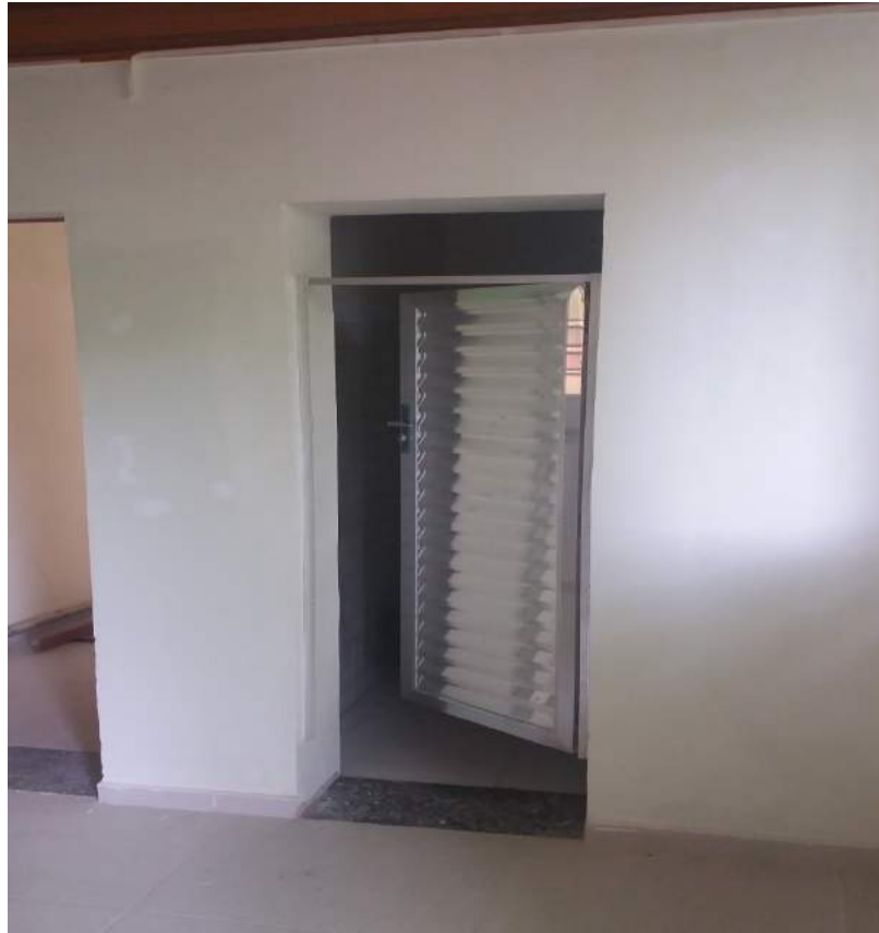
ANEXO II FRENTE DO NOVO ANEXO DA PNR DA DAST.