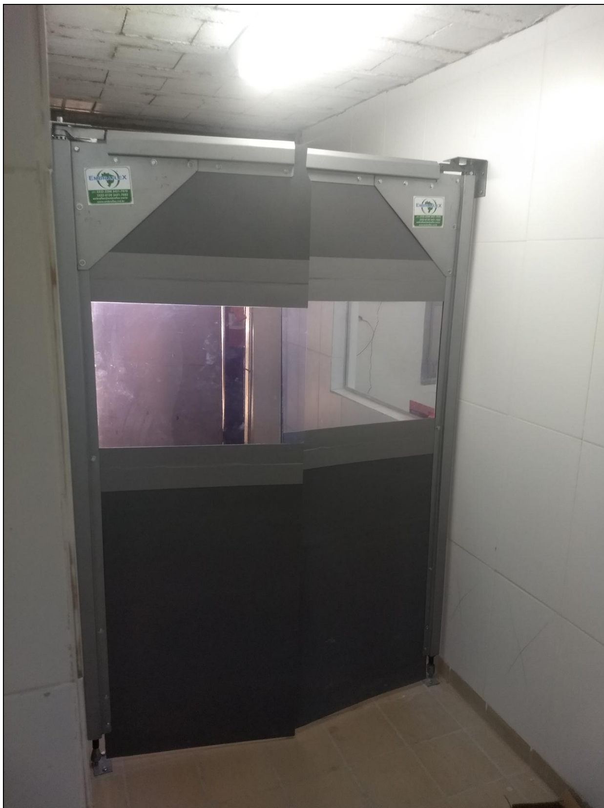
Foto 04 - Instalação de portas de PVC (vai e vem) nos acessos internos do RU.