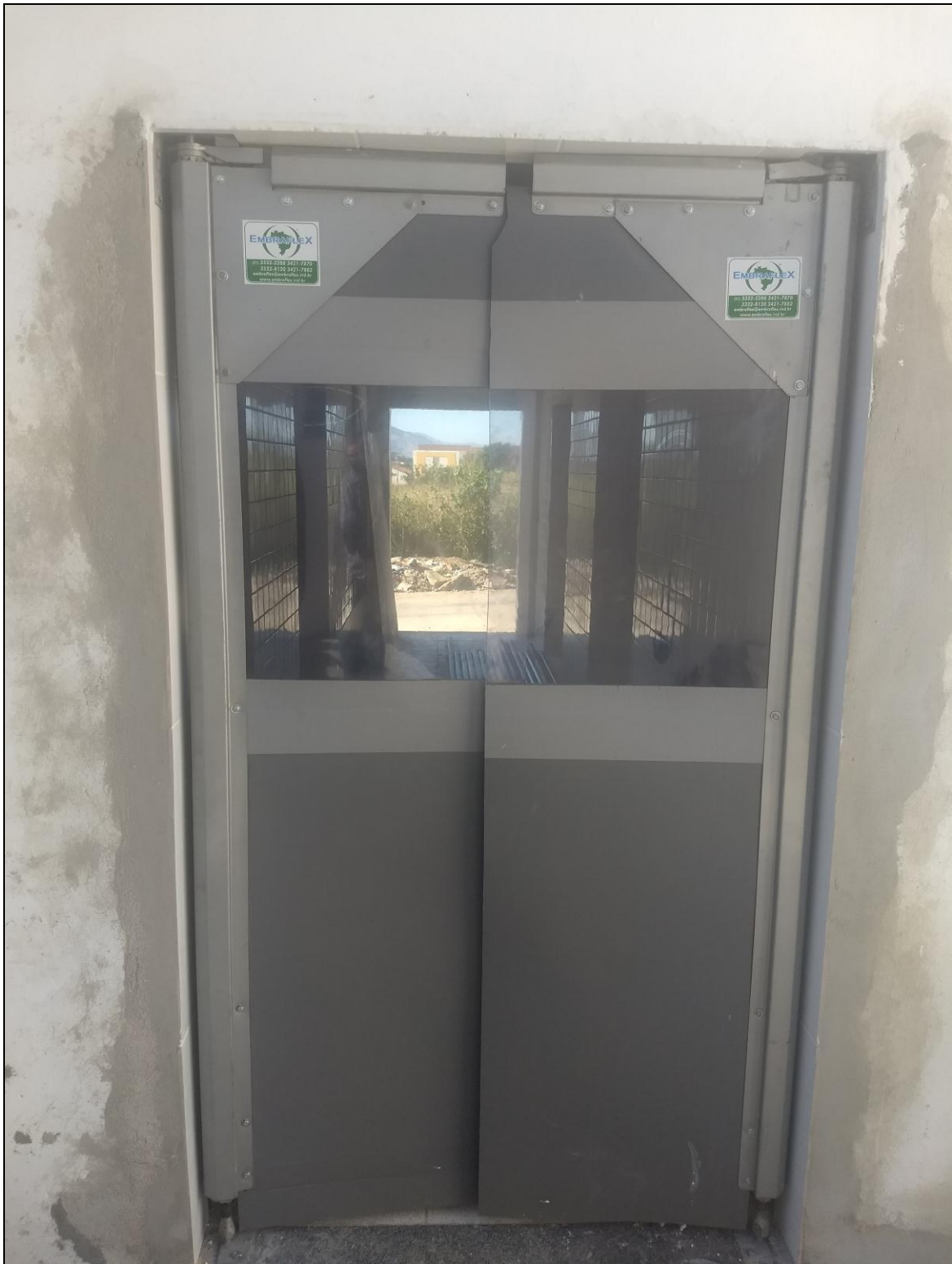
Foto 03 - Instalação de portas de PVC (vai e vem) nos acessos internos do RU.