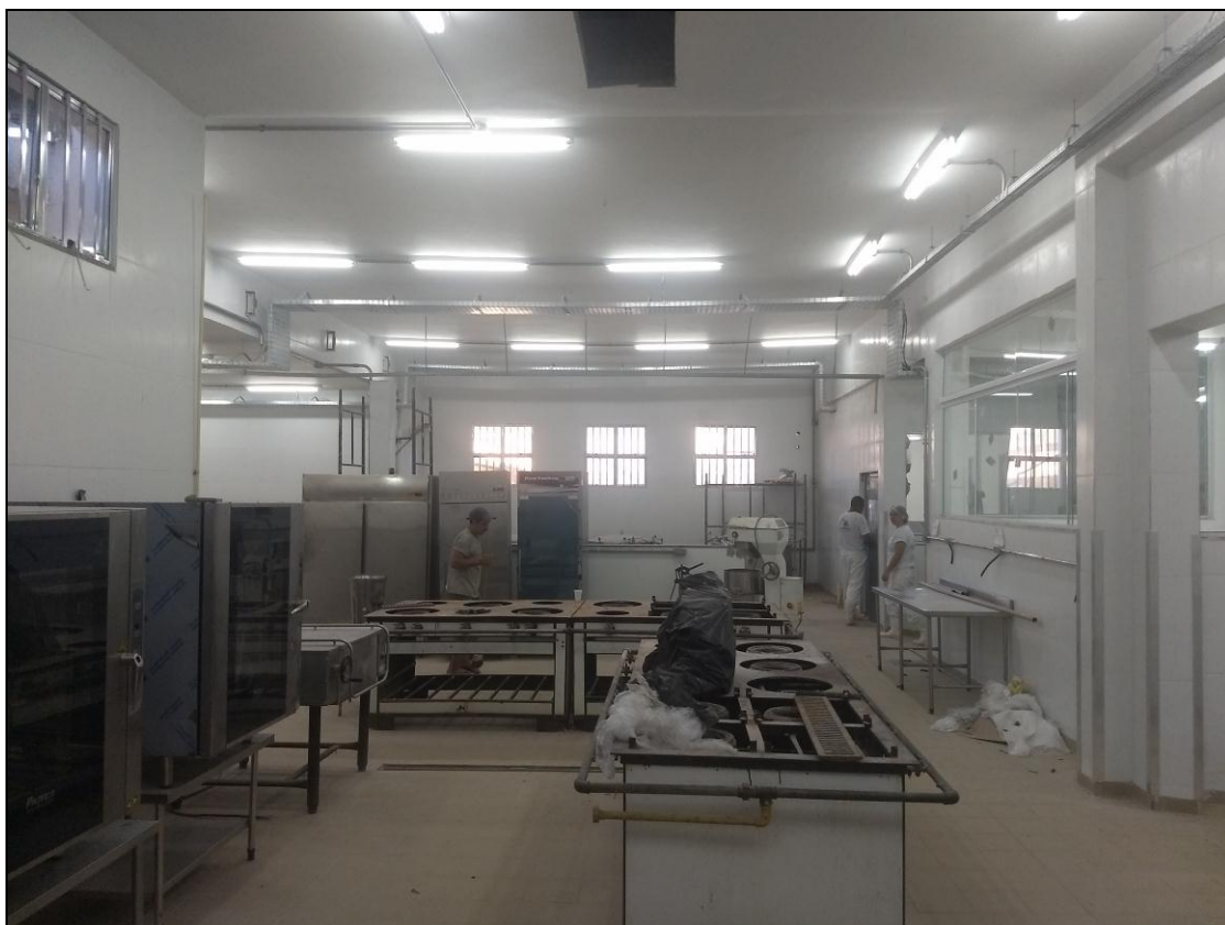
Foto 05 - Conclusão da instalação da rede elétrica na área de ampliação da cozinha.