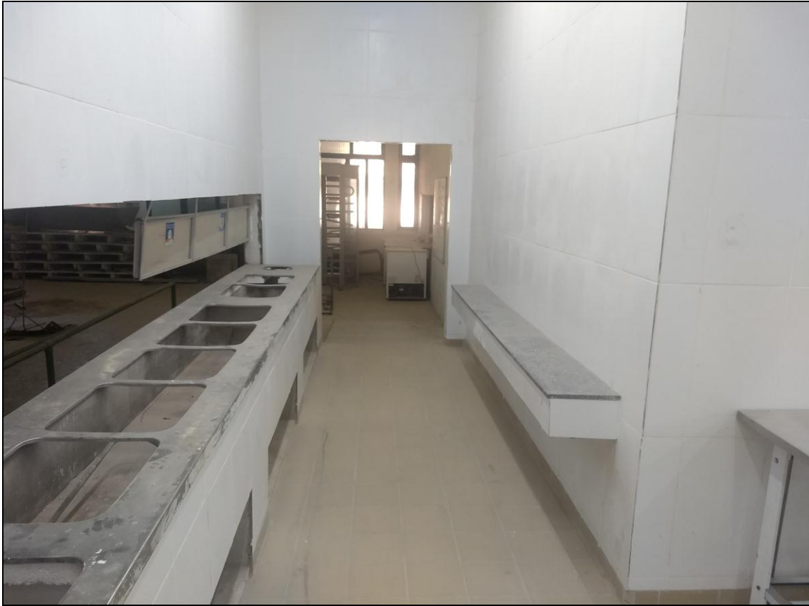
Foto 09 – Vista da linha de distribuição de refeições (lado esquerdo).