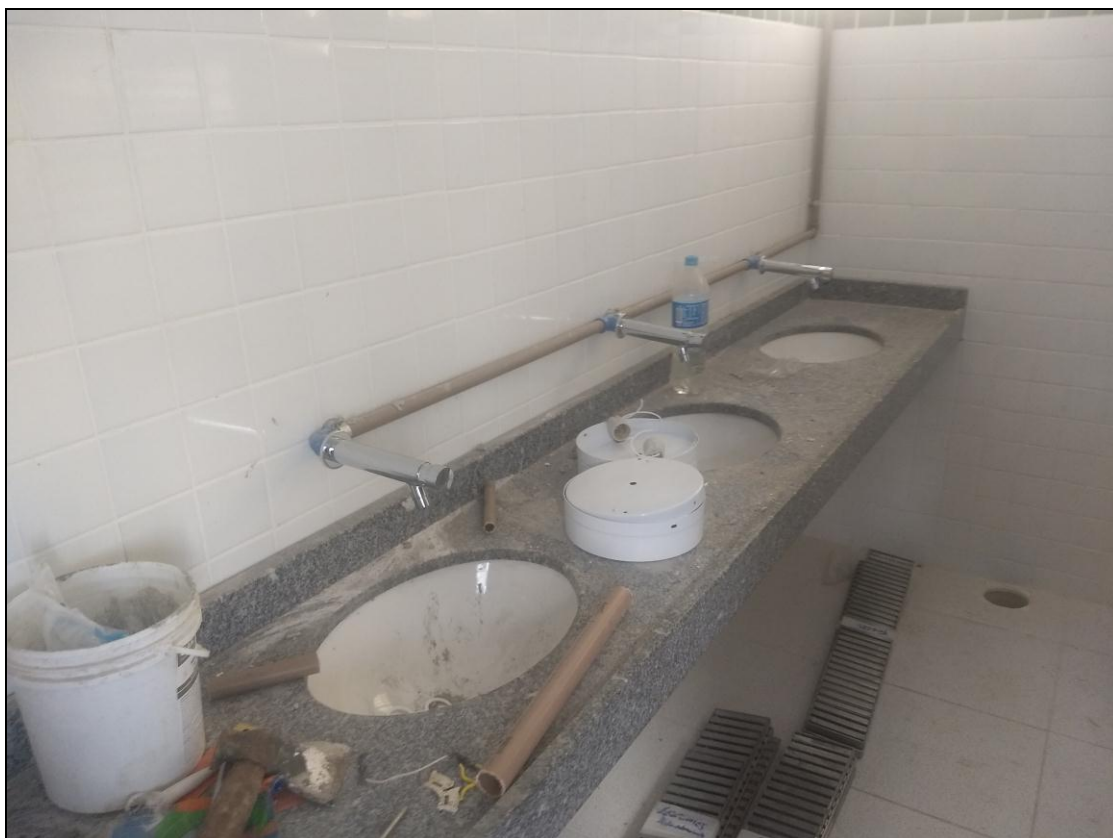
Foto 01 - Finalização da instalação das tubulações da rede hidráulica (torneiras).