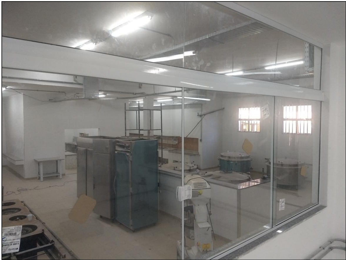
Foto 13 – Vista da área de cocção a partir do visor da sala de supervisão