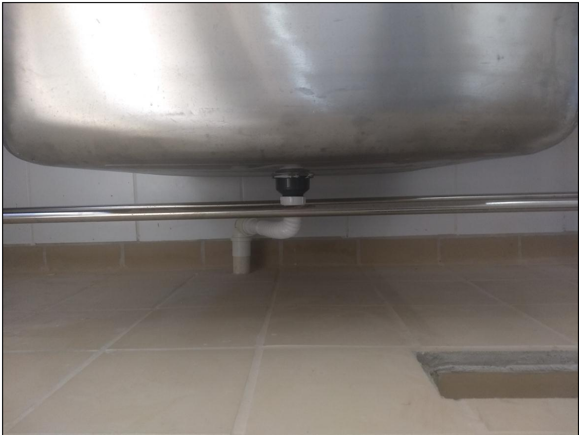
Foto 07 - Finalização da instalação das conexões da rede sanitária do RU.