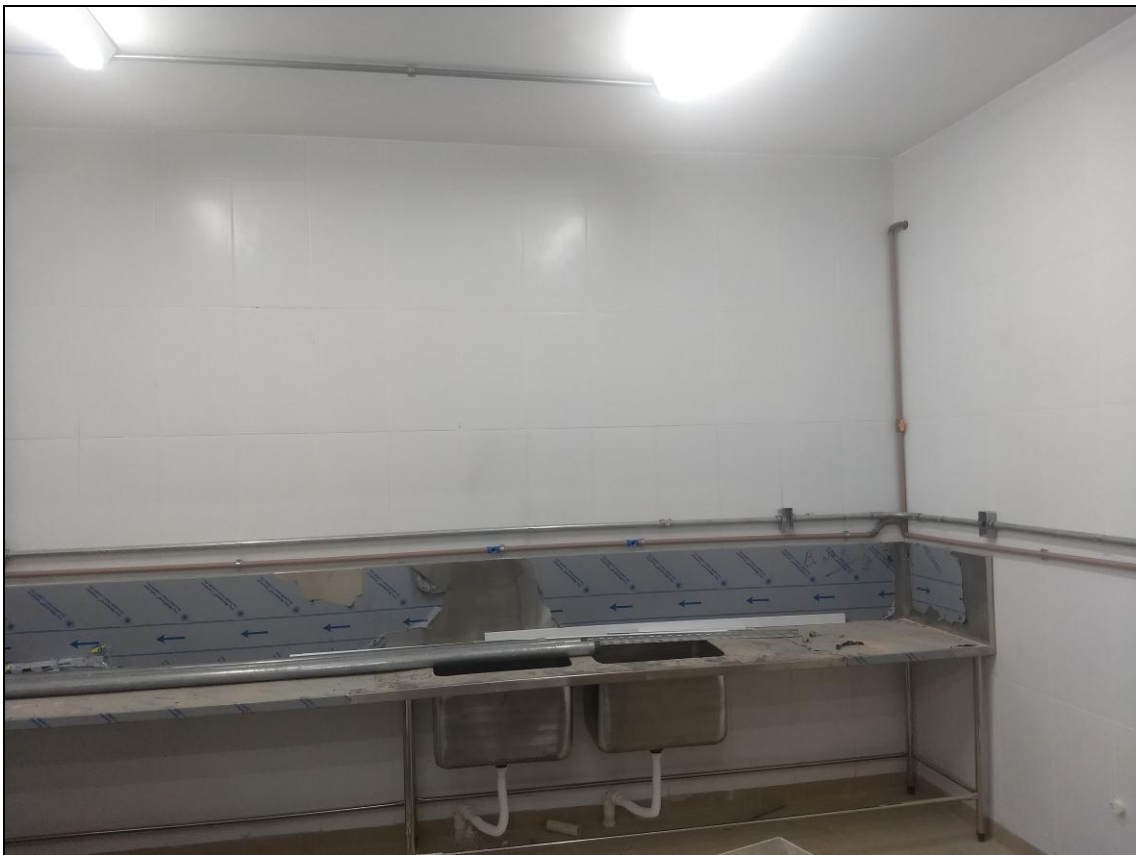
Foto 08 - Finalização da instalação das conexões da rede sanitária do RU.