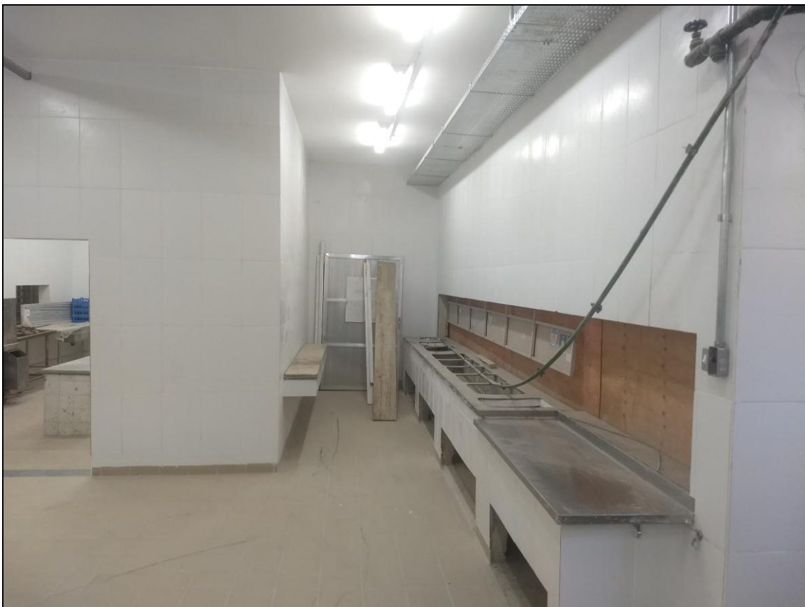
Foto 10 – Vista da linha de distribuição de refeições (lado direito).