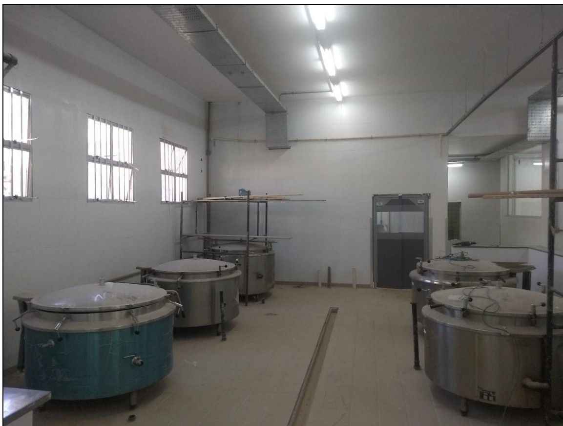
Foto 11 – Vista da área de cocção com os panelões a vapor posicionados.