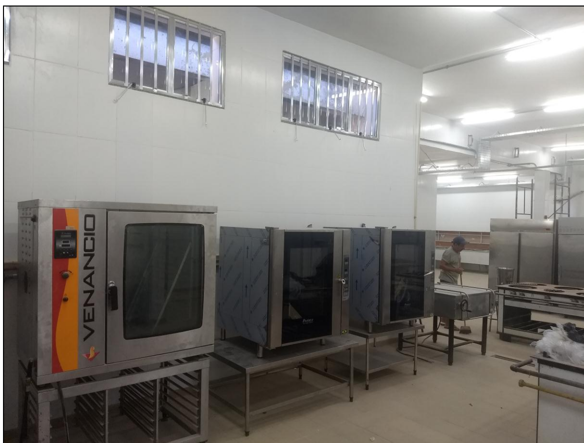
Foto 12 – Vista da área de expansão da cozinha com os equipamentos elétricos posicionados.