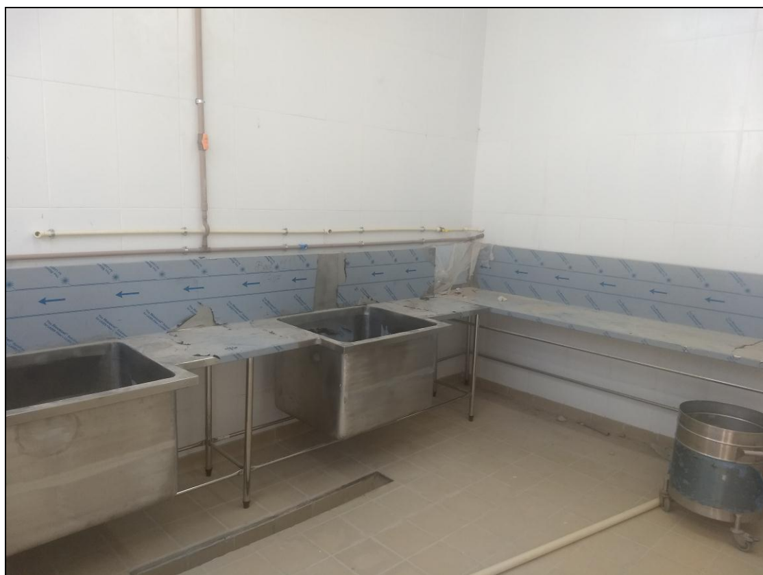
Foto 02 - Finalização da instalação das tubulações da rede hidráulica (torneiras).