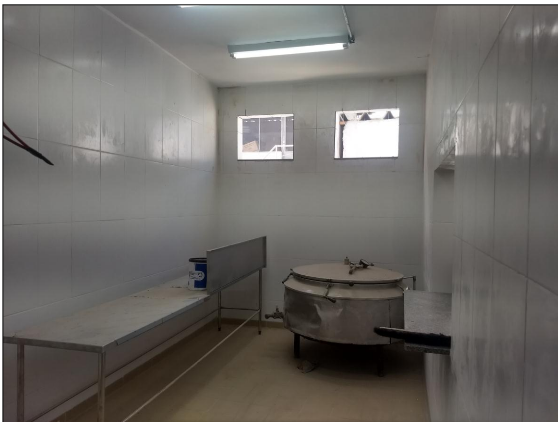
Foto 20 - Visão geral do interior da área reformada de ampliada da cozinha do RU