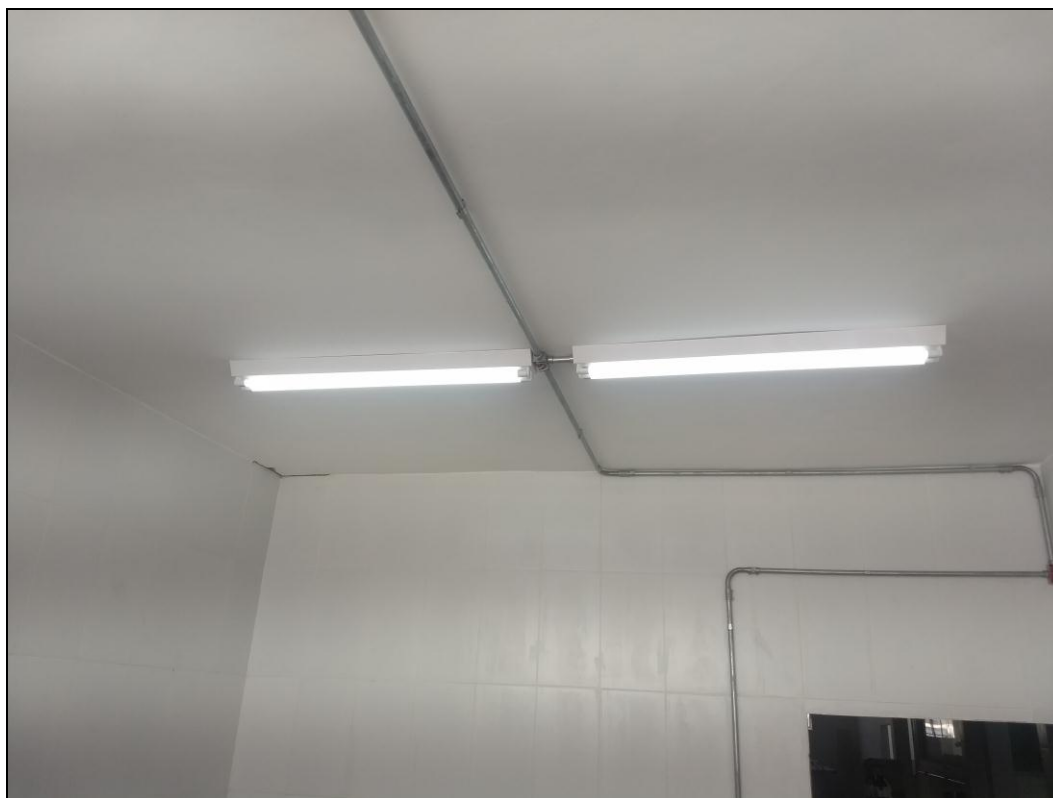
Foto 01 – Continuidade da instalação da infraestrutura e da fiação da rede elétrica da área reformada