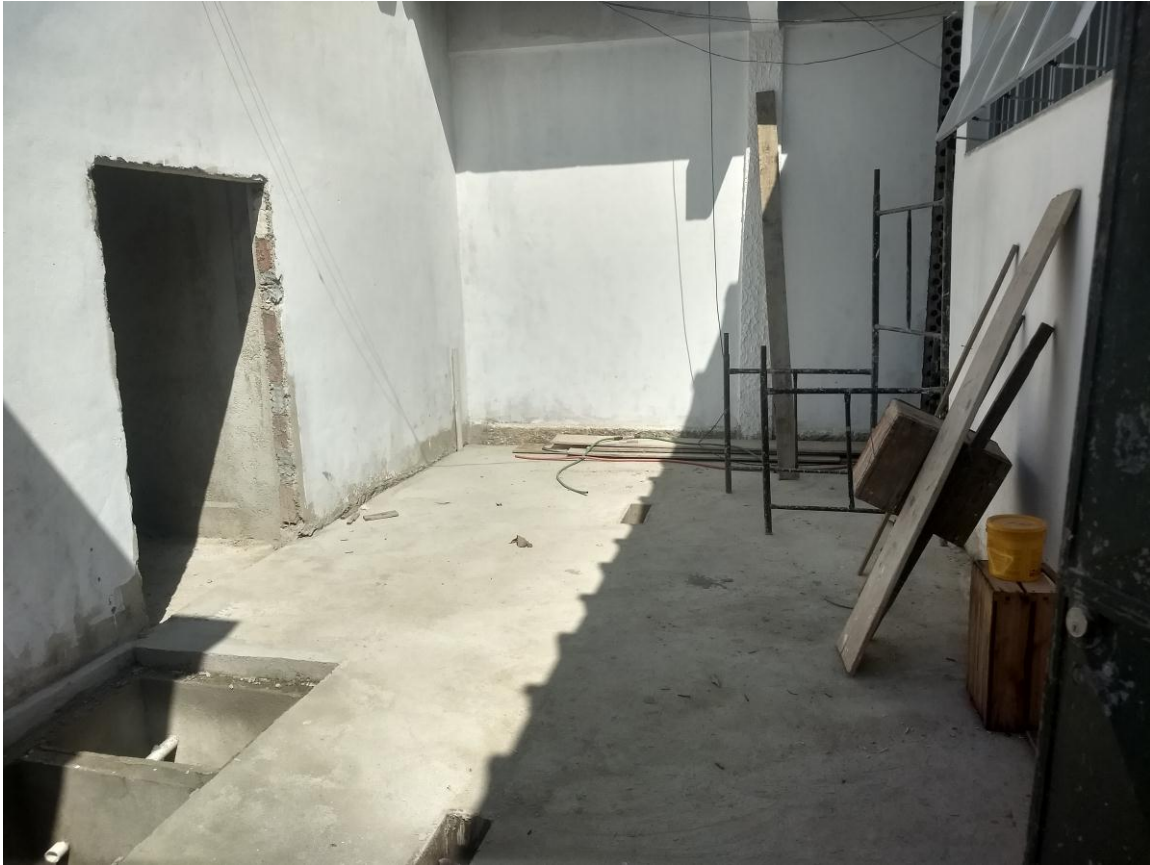
Foto 11 - Construção de piso de alvenaria na área externa entre a cozinha e a lixeira climatizada