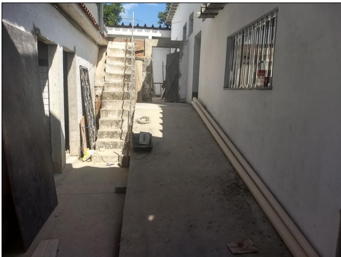
Foto 17 – Visão geral da rampa de acesso da área de descarga até a cozinha