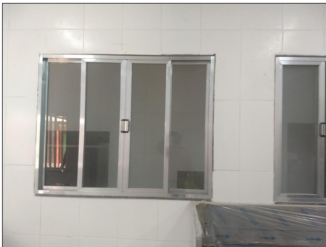
Foto 04- Instalação de portas e janelas na área reformada