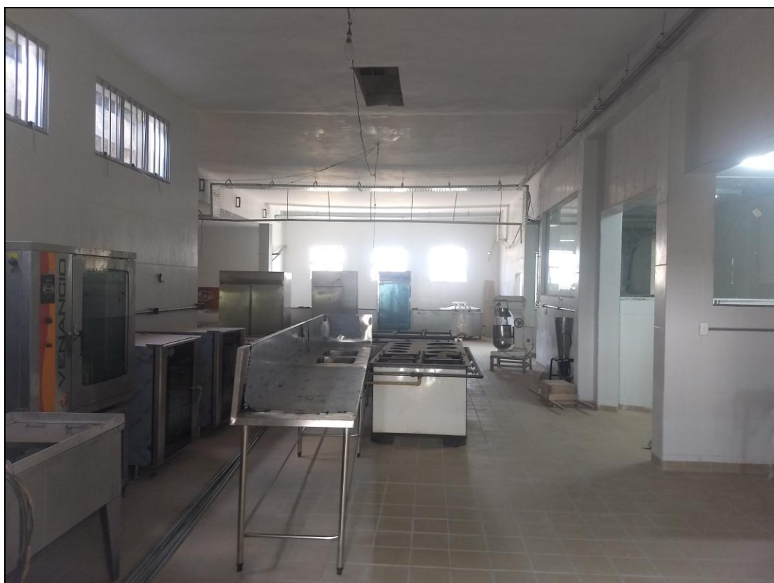
Foto 18 – Visão geral do interior da área reformada e ampliada da cozinha do RU