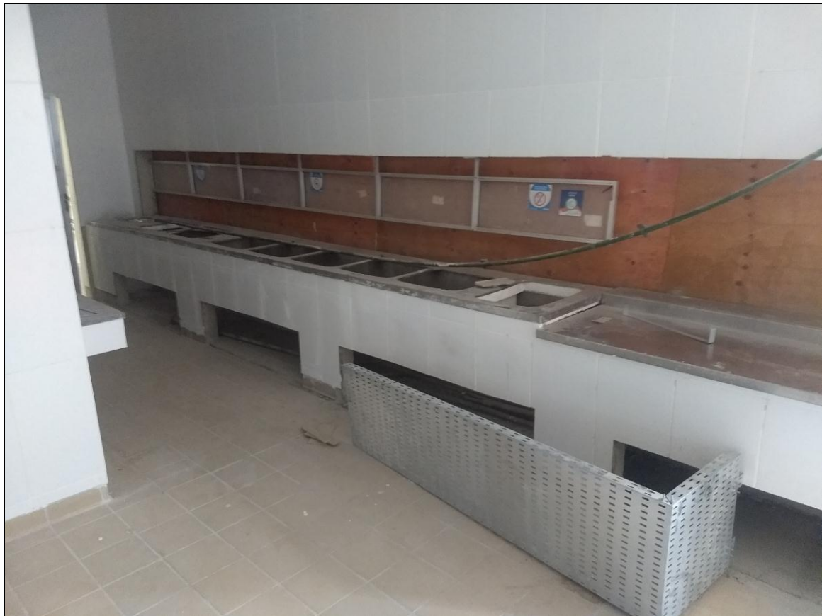
Foto 05 – Finalização das bancadas de distribuição das refeições (lado direito)