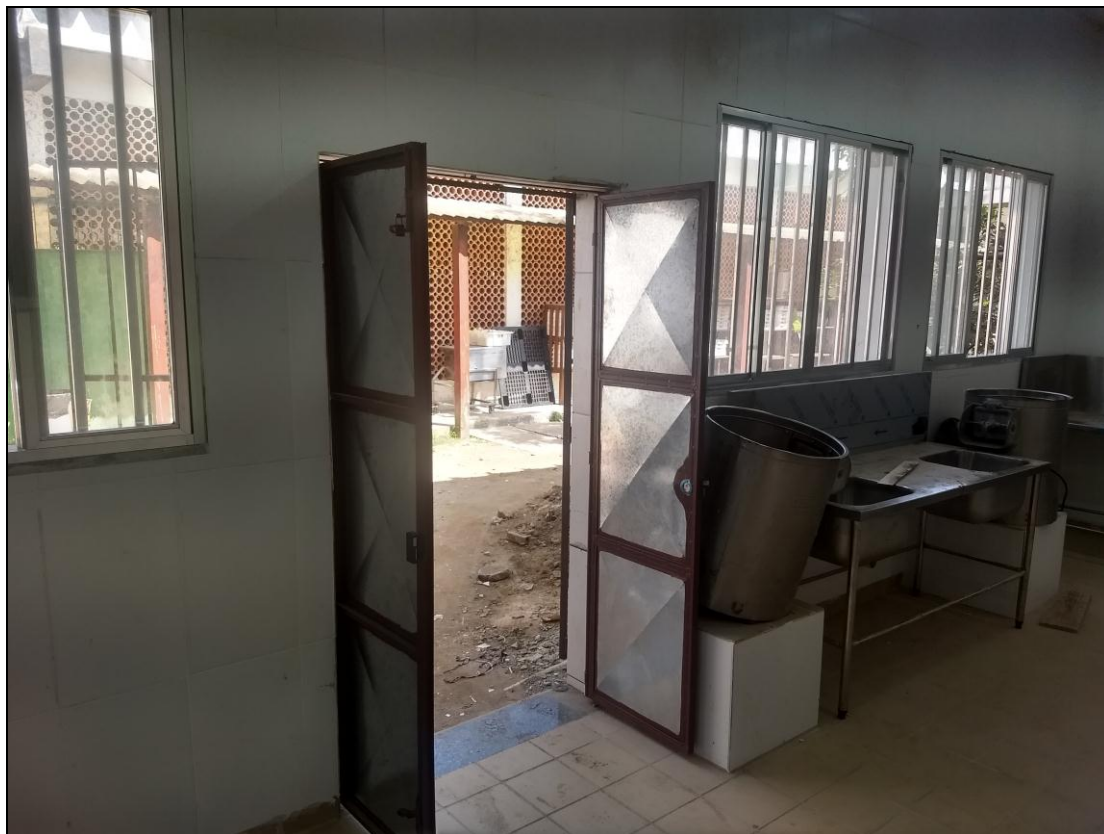
Foto 03 - Instalação de portas e janelas na área reformada