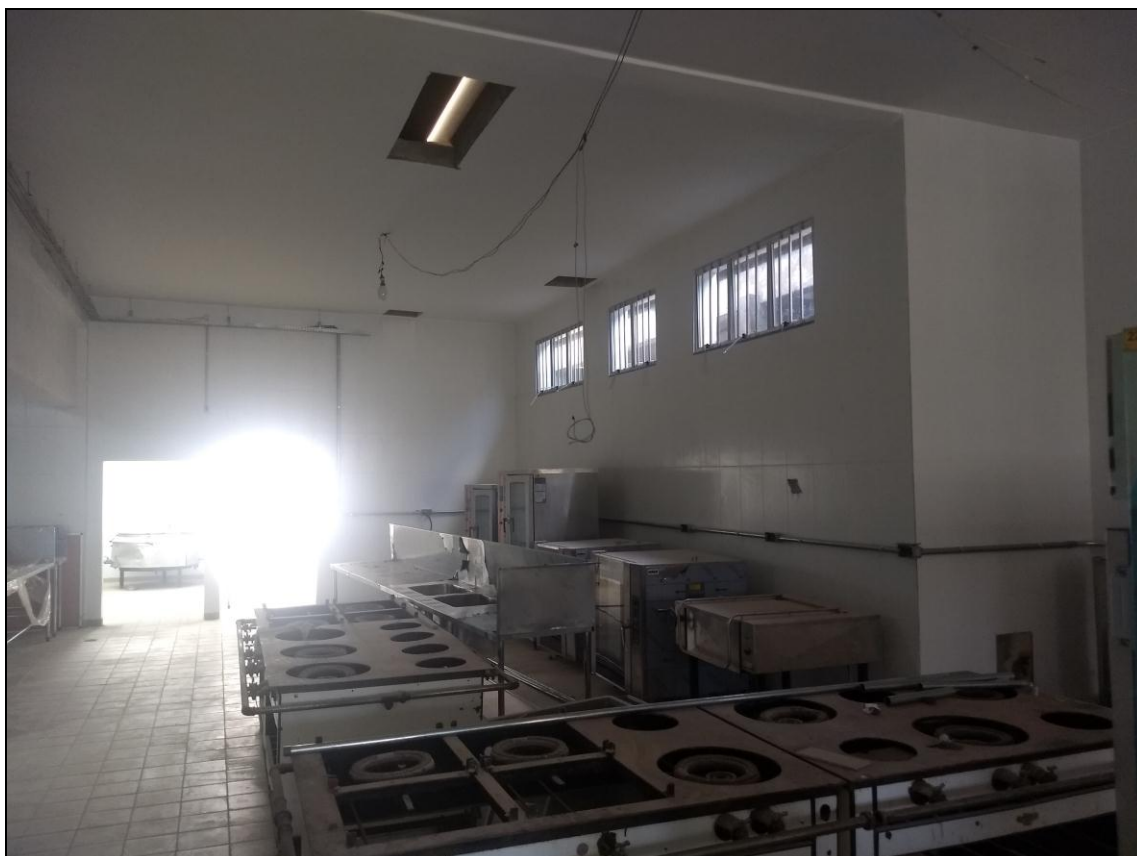
Foto 19 - Visão geral do interior da área reformada de ampliada da cozinha do RU