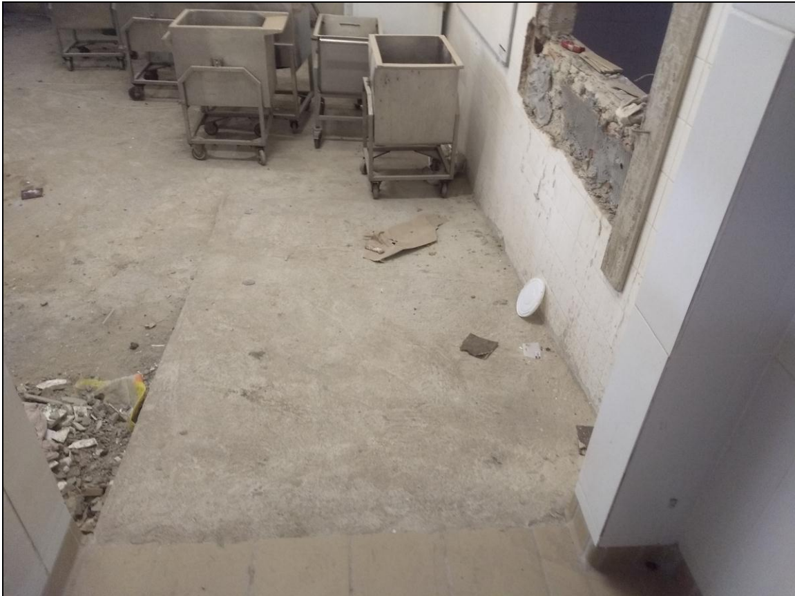
Foto 09 – Instalação da rampa de acesso dos refeitórios até a área da cozinha (lado esquerdo)