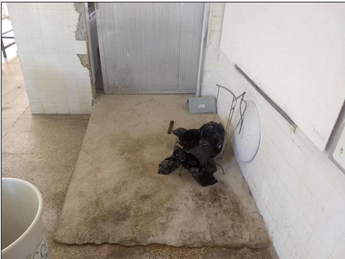
Foto 10 – Instalação da rampa de acesso dos refeitórios até a área da cozinha (lado direito)