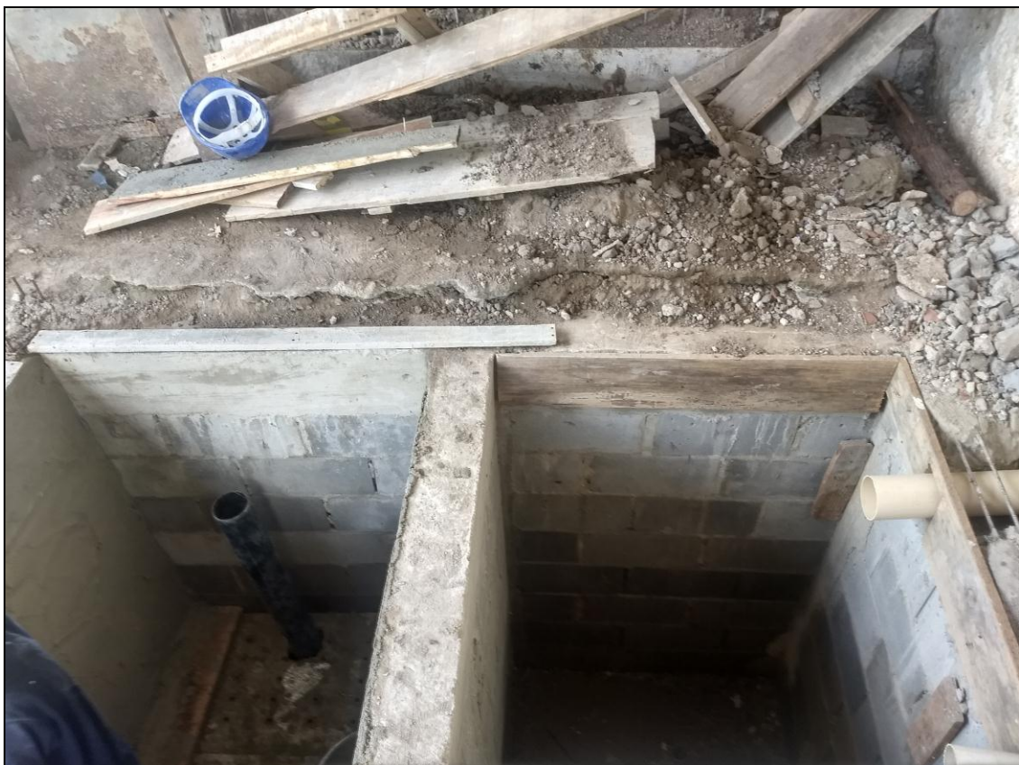
Foto 16 - Continuidade da construção de uma fossa e filtro para a rede de esgoto dos banheiros dos funcionários