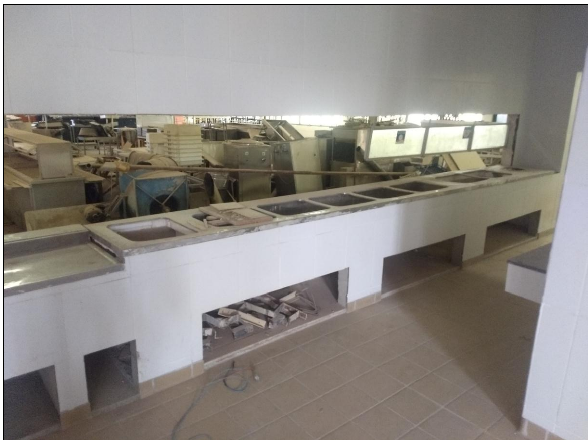
Foto 06 - Finalização das bancadas de distribuição das refeições (Lado esquerdo)