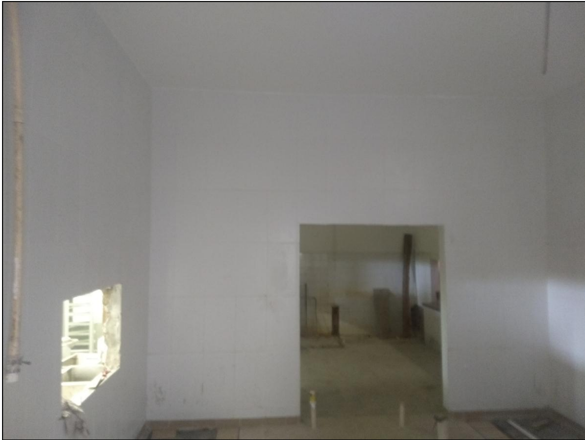
Foto 07 – Conclusão do revestimento cerâmico da sala de recepção das bandejas