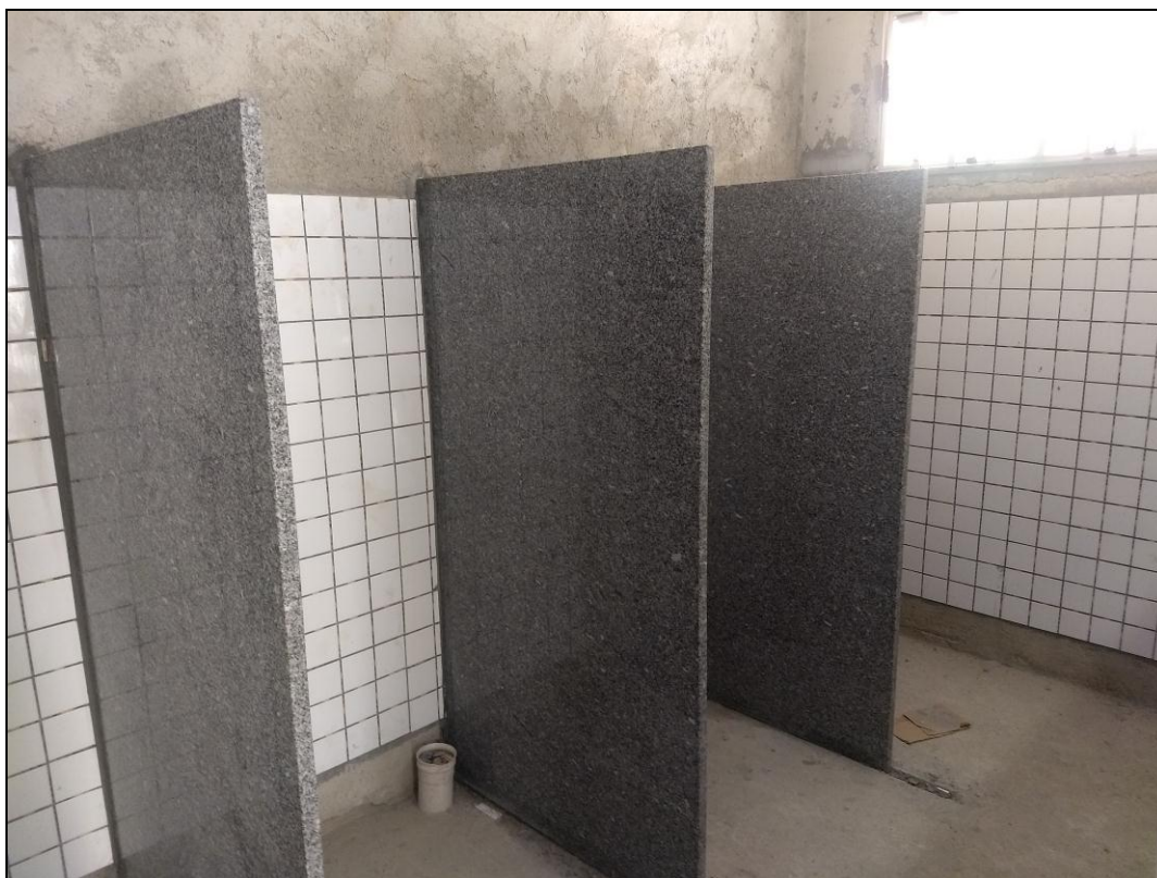
Foto 13 - Instalação de revestimento cerâmico, bancadas, janelas e divisórias de granito nos banheiros dos funcionários