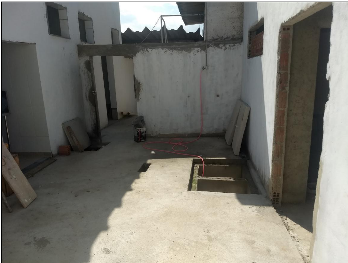
Foto 12 - Construção de piso de alvenaria na área externa entre a cozinha e a lixeira climatizada