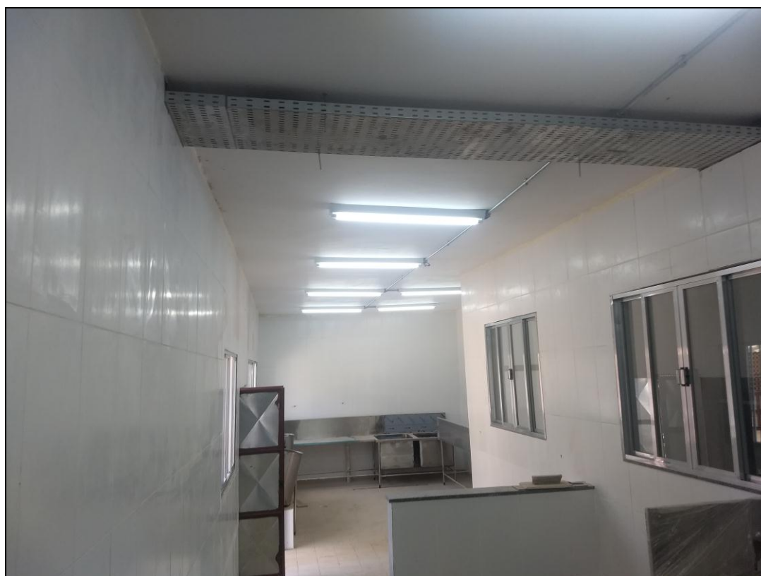
Foto 02 - Continuidade da instalação da infraestrutura e da fiação da rede elétrica da área reformada