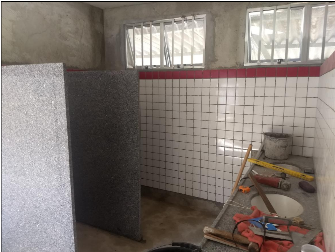
Foto 15 – Instalação de revestimento cerâmico, bancadas, janelas e divisórias de granito nos banheiros dos funcionários