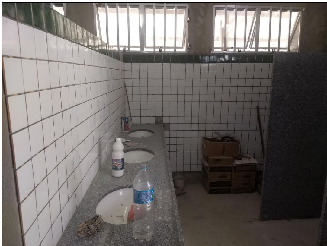
Foto 14 - Instalação de revestimento cerâmico, bancadas, janelas e divisórias de granito nos banheiros dos funcionários