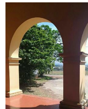
Prédio principal – Departamento de Geografia

X SEMANA DE INTEGRAÇÃO DE CALOUROS GEOGRAFIA – DEPARTAMENTO DE GEOGRAFIA/IA A GEOGRAFIA E A SOCIEDADE QUE QUEREMOS