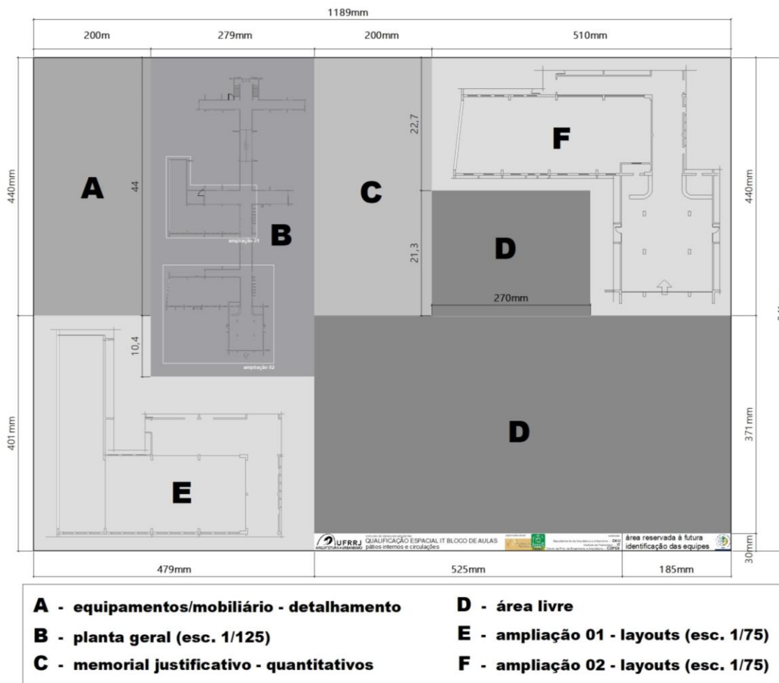
Figura 2: prancha modelo para apresentação das propostas

10.2. As propostas devem apresentar os elementos gráficos necessários ao perfeito entendimento das soluções propostas, a exemplo de Plantas Baixas, Cortes, Perspectivas, Elevações e Detalhamentos Construtivos. Justificativas de projeto e especificações técnicas (incluindo quantidades e viabilidades), podem ser apresentadas em forma de texto, tabelas, diagramas e/ou referências. Todas estas informações devem estar colocadas segundo modelo de apresentação da prancha A0 acima caracterizada.