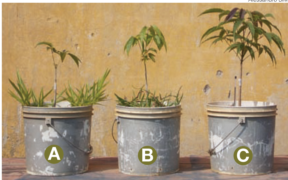
Plantas daninhas. Braquiaria decumbes (A) e Braquiaria humidicola (B) influenciam o crescimento de mudas de ipê roxo. No vaso (C), o crescimento da muda sem matocompetição

A importância do controle de plantas daninhas