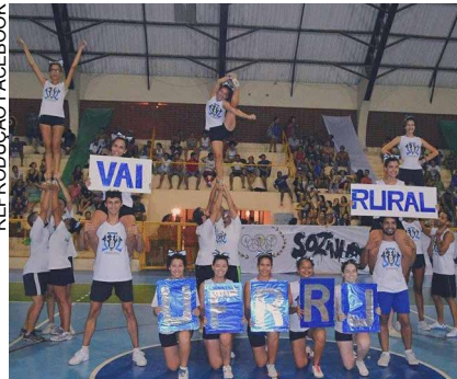
Harmonia. Em uma atividade coletiva como o cheerleading , os atletas trabalham em conjunto na busca pela excelência