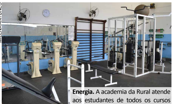
Energia. A academia da Rural atende aos estudantes de todos os cursos