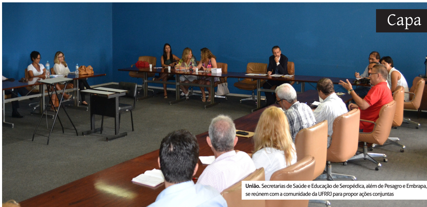
União. Secretarias de Saúde e Educação de Seropédica, além de Pesagro e Embrapa, se reúnem com a comunidade da UFRRJ para propor ações conjuntas